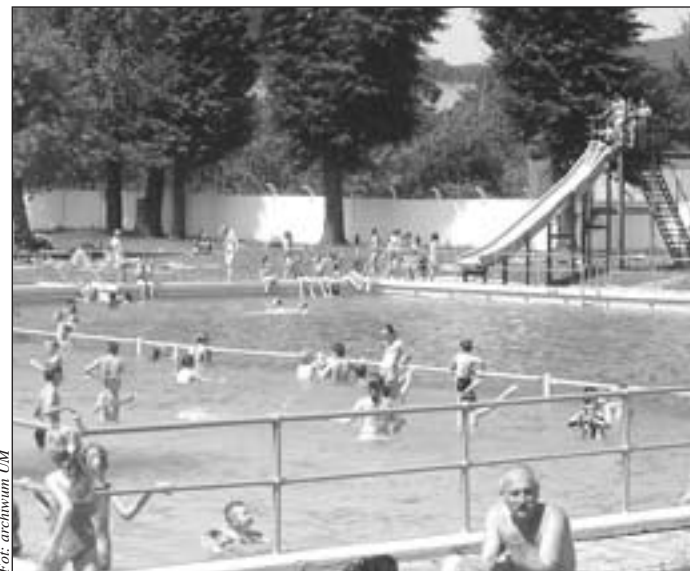
Basen Miejski w Pieszycach zaprasza!

Z początkiem wakacji OTWARTY ZOSTAŁ BASEN MIEJSKI W PIESZYCACH. Każdy, kto ma ochotę na odrobinę orzeźwienia w upalny dzień, może korzystać z kąpieli.