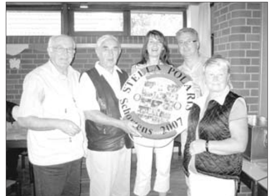
Niestety - wszystko co dobre szybko się kończy i musieliśmy wracać do własnych domów

obiad do Domu Marcina Lutra. Tam też nastąpiła serdeczna wymiana podziękowań. Po obiedzie uczestniczyliśmy w paradnym przejeździe ulicami miasta, gdzie na chodnikach stali tłumnie mieszkańcy miasta