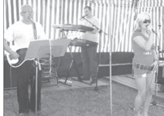
W niedzielę 15 lipca na boisku sportowym w Kamionkach odbył się piknik sołecki. Skwar jaki lał się z nieba nie odstraszył mieszkańców.

W związku z ciągłym rozwojem Zespołu Szkół przyjmowani byli nowi nauczyciele. Równocześnie z napływem nowej kadry część zasłużonych wieloletnich nauczycieli odeszła na emeryturę lub rentę.