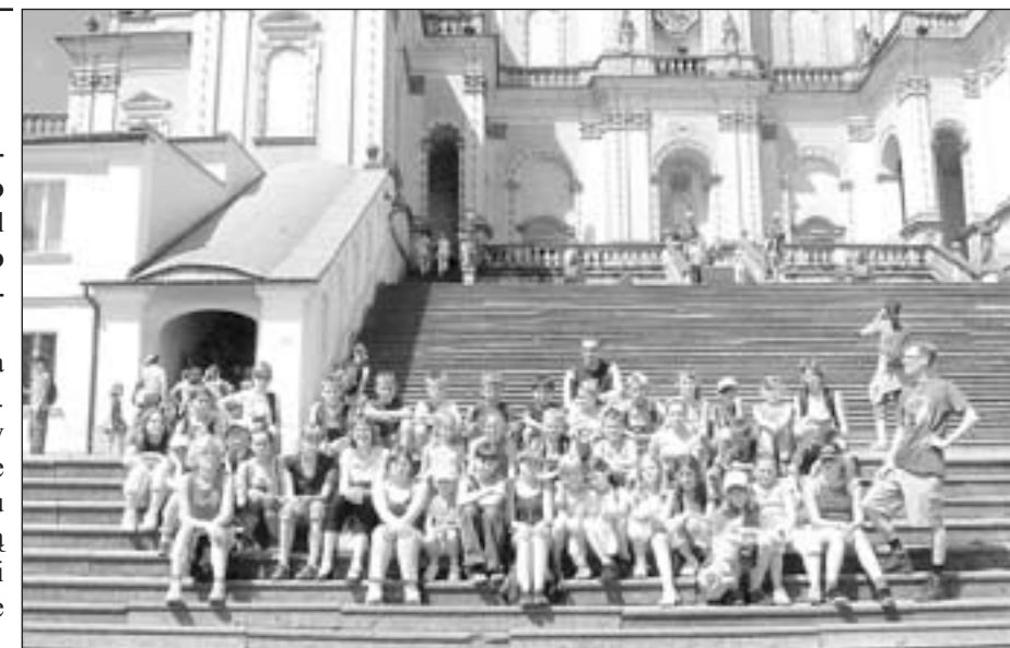
Od 17 lipca w naszym mieście przebywa 39-osobowa kolonia z partnerskiego miasta Świecie