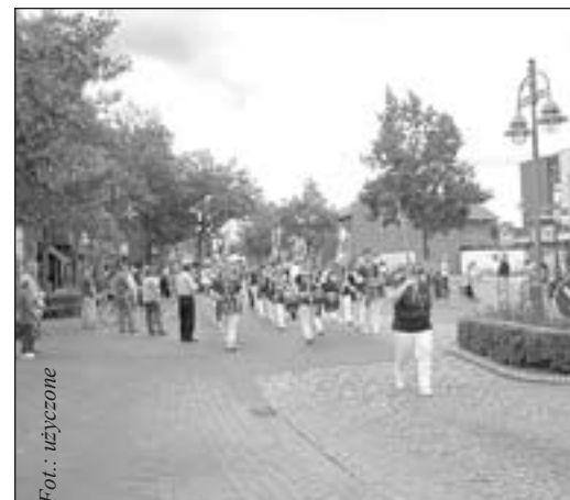
Po obiedzie uczestniczyliśmy w paradnym przejeździe ulicami miasta...