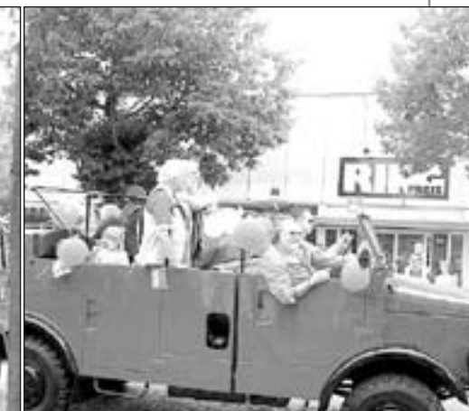
Kawalkada pięknie przystrojonych pojazdów przemierzyła kilka kilometrów ulic rzucając oczekującym kwiaty i cukierki