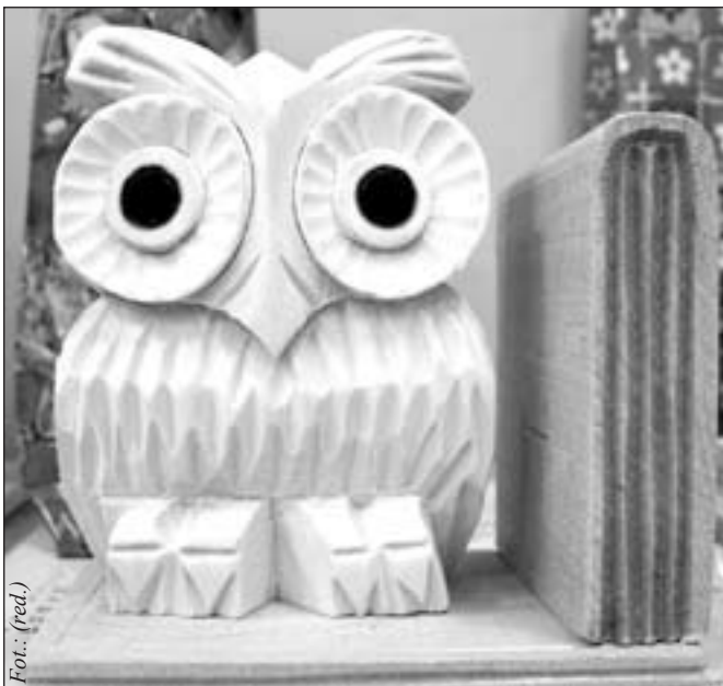
W roku szkolnym 2006/2007 nagrodę burmistrza Pieszycy otrzymało dziewięć osób