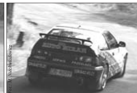
Andrzej Papamichalis zwyciężył w klasie IV i klasyfikacji generalnej