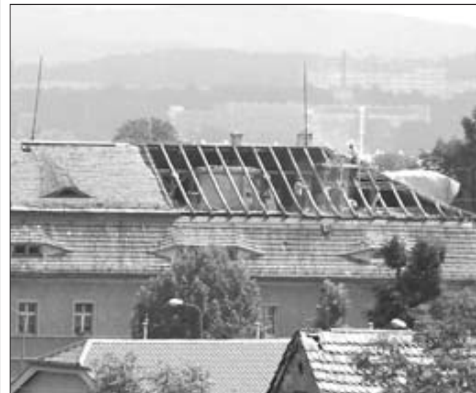
Wymiana pokrycia dachowego powinna zostać zakończona do 31 sierpnia br.

20 czerwca pomiędzy gminą Pieszyce a Spółdzielnią Rzemieślniczą Wielobranżową z Bielawy podpisana została umowa na zadanie pn. Wymiana pokrycia dachu w budynku Przedszkola nr 2 w Pieszycach przy ulicy Bielawskiej.