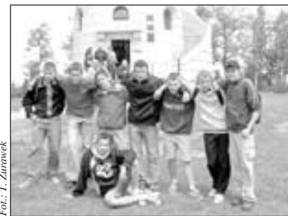
Na zakończenie sezonu trampkarze wybrali się na Wielką Sowę

Młodzi koledzy Juniorów - Trampkarze zasłużyli również na słowa pochwały. Tym bardziej, że do rozegrania mieli aż 20 spotkań w sezonie. 16 zwycięstw, jeden remis i trzy porażki to naprawdę imponujący bilans, który pozwolił na zajęcie „tylko” drugiego miejsca.