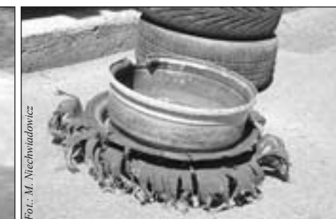
Zbyt głębokie cięć zakrętów czasami kończą się niezbyt szczęśliwie

sekund. Zamknąłem drzwi, zaciągnąłem z całej siły pasy. 10 sekund... - Swoim tempem – powiedziałem do kierowcy. 5 sekund... Ręka sekundanta łąduje na szybie. 4.... 3...., 2...., 1... START! Ruszamy pod górę. - 50 L2 | 50 P3 - | KRÓTKA L2 CIASNY NIE WYPUSZCZAJ → P3 WYPUŚC – dyktuję go i wyraźnie. Jedziemy szybko, ale bez zbędnego ryzyka. Wiem, że Piotrek musi się przełamać. Na górze odnotowaliśmy piąty czas w klasie - 4:39,7. Nie jest źle, ale wiemy, że można szybciej. Z niecierpliwością czekaliśmy na naszych znajomych braci. W pierwszym podjeździe byli szybsi o 5,3 sekundy. Na górę wjechali pozostali zawodnicy i wszyscy zjechaliśmy na dół. Czas na podjazd numer 2.