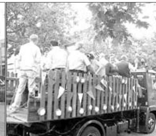
...gdzie na chodnikach stali tłumnie mieszkańcy miasta całymi rodzinami.