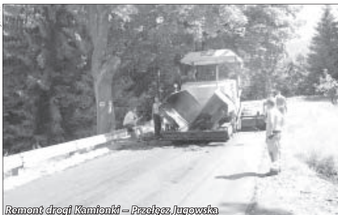
Remont drogi Kamionki – Przełęcz Jugowska

Zakończony został remont drogi gminnej w Piskorzowie, gdzie odnowione zostały łącznie 134 m jezdni w kierunku