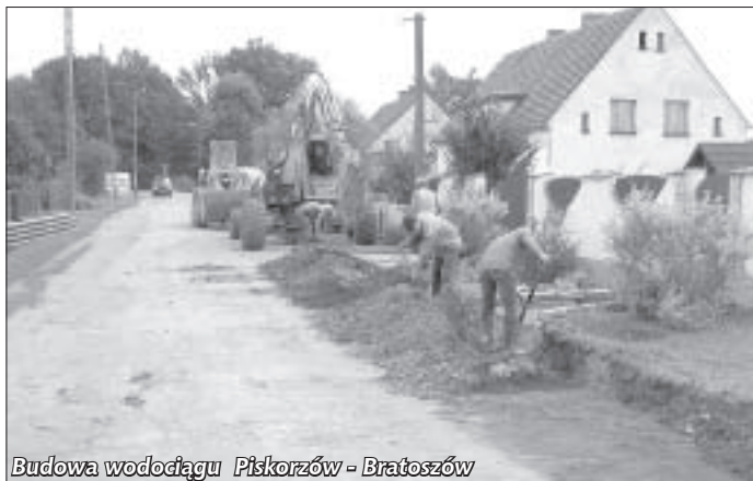
Budowa wodociągu Piskorzów - Bratoszów

Trwają prace końcowe przy budowie wodociągu Piskorzów – Bratoszów, które prowadzone są przez Przedsiębiorstwo