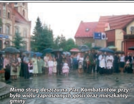
Mimo strug deszczu na Plac Kombatanów przybyło wielu zaproszonych gości oraz mieszkańcy gminy