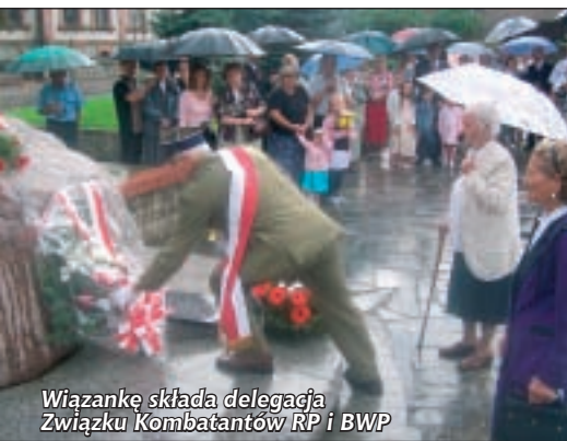
Wiązankę składa delegacja Związku Kombatanów RP i BWP