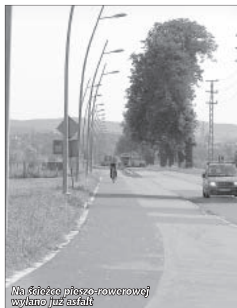
Na ścieżce pieszo-rowerowej wylano już asfalt

Trwają także prace końcowe przy budowie ścieżki pieszo-rowerowej na trasie Pieszycy – Dzierżoniów. Zainstalowane zostały wszystkie słupy oświetleniowe, wykańczane są miejsca odpoczynku podróżnych – tzw. mopy, a w połowie sierpnia nawierzchnię zaczęto pokrywać asfaltem. Przypomnijmy - ścieżka ma długość ponad 3 km, a jej szerokość wynosi 3,50 m. Inwestycja finansowana jest z trzech źródeł: Dolnośląskiej Służby Dróg i Kolei we Wrocławiu, miasta Pieszycy i miasta Dzierżoniów. Całość inwestycji to koszt 3 969 745, 19 zł. Wszystko wskazuje na to, że we wrześniu uda się zakończyć to zadanie.