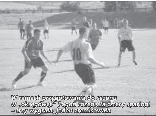
W ramach przygotowania do sezonu w „okręgówce” Pogoni rozegrała cztery sparingi – trzy wygrała, jeden zremisowała

Zgodnie z ustaleniami przed pierwszym spotkaniem na piasezyckim stadionie powstanie ogrodzenie przejścia dla sędziów i zawodników z szatni na boisko, a do rozpoczęcia rundy rewanżowej powstaną nowe ławki dla zawodników rezerwowych. Przed rozpoczęciem kolejnego sezonu na terenie stadionu musi powstać wydzielony sektor dla kibiców drużyny gości.