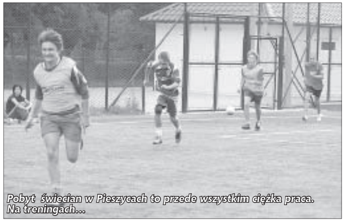
Pobył świecian w Pieszycach to przede wszystkim ciężka praca. Na treningach...

Już w poniedziałek 2 sierpnia tuż po śniadaniu piłkarze udali się na pierwszy trening na Orliku. Wieczorem świecianie zwiedzali sztolnie w Osówce. We wtorek był czas oczywiście na obowiązkowy, codzienny trening, ale także na basen i pierwszy sparing z juniorami MKS Pogoń Pieszycze. Wynik – 2:1 dla Świecia. Środa to podwójny – poranny i wieczorny trening, oraz wspólna gra w kręgle. W czwartek odbył się sparingowy rewanż piłkarzy. Tym razem z wynikiem 8:1 zwyciężyli juniorzy Pogoni. Piątek był typowym dniem turystycznym. Po śniadaniu piłkarze z partnerskiego miasta udali się na Wielką Sowę, a w drodze powrotnej do gospodarstwa agroturystycznego „Cicha Woda” w Lasocinie. Sobota ponownie stała pod znakiem pracy – o godzinie 10:00 odbył się pierwszy, a o 16:30 drugi trening z piłką. W niedzielny poranek, tuż po śniadaniu,