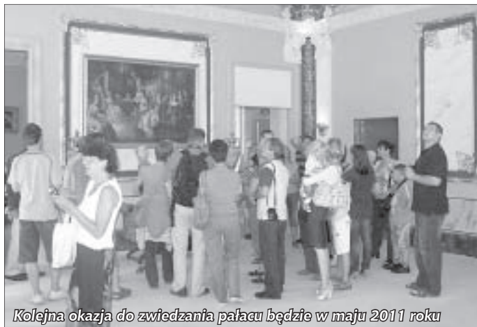
Kolejna okazja do zwiedzania pałacu będzie w maju 2011 roku