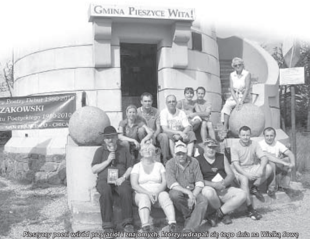
Pieszycy poeci wśród przyjaciół i znajomych, którzy wdrapali się tego dnia na Wielką Sowę