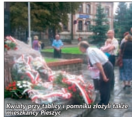
Kwiaty przy tablicy i pomniku złożyli także mieszkańcy Pieszyce