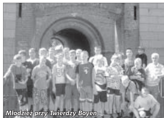
Młodzież przy Twierdzy Boyen