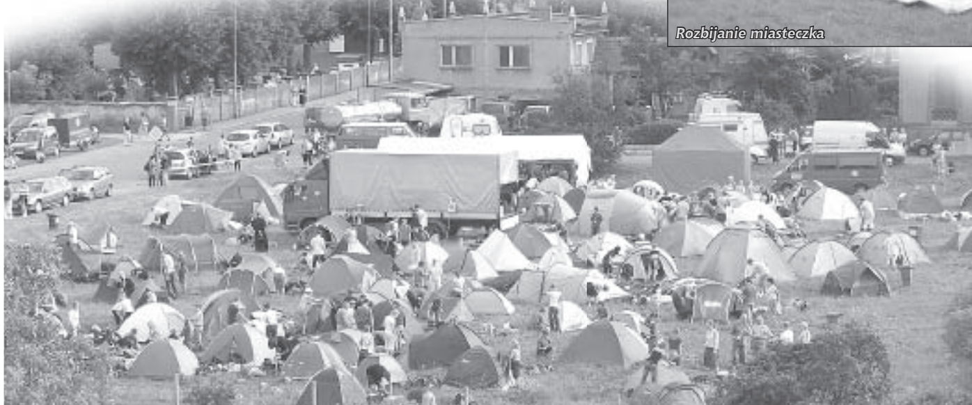
To tylko część uczestników pielgrzymki, która gościła w naszej gminie 31 lipca i 1 sierpnia