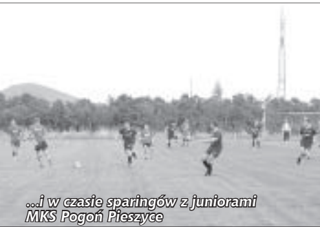
...i w czasie sparingów z juniorami MKS Pogoń Pieszycze