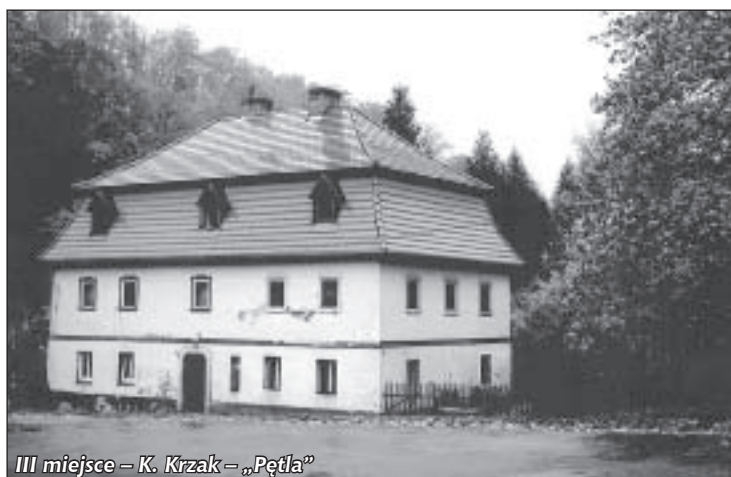
III miejsce – K. Krzak – „Pętla”