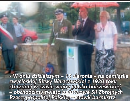
- W dniu dzisiejszym – 15 sierpnia – na pamiątkę zwycięskiej Bitwy Warszawskiej z 1920 roku stoczonej w czasie wojny polsko-bolszewickiej – obchodzimy święto państwowe Sił Zbrojnych Rzeczypospolitej Polskiej – mówił burmistrz