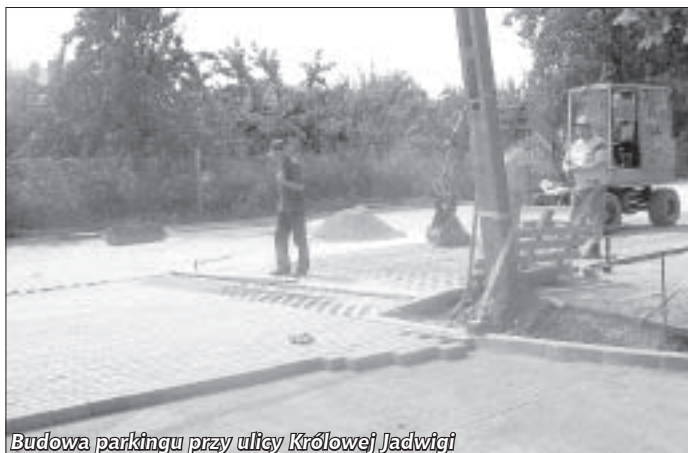
Budowa parkingu przy ulicy Królowej Jadwigi

leśniczówki. Wyremontowane zostały także istniejące przepusty oraz oczyszczono i pogłębiono rowy. Wartość realizacji zadania to kwota 44 527,83 zł. Ten sam wykonawca – czyli Świdnickie Przedsiębiorstwo Budowy Dróg i Mostów, prowadzi remont drogi gminnej w Rościszowie, gdzie wyremontowanych zostanie 900 m drogi, a ponadto przewiduje się remont istniejących przepustów, podniesienia istniejących wpustów kanaliza-