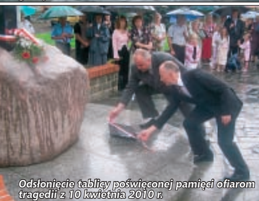
Odsłonięcie tablicy poświęconej pamięci ofiarom tragedii z 10 kwietnia 2010 r.