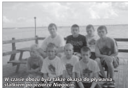
W czasie obozu była także okazja do pływania statkiem po jeziorze Niegocin.