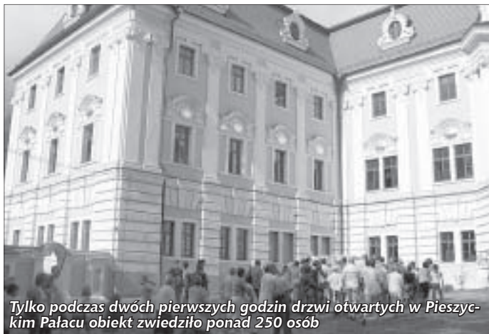
Tylko podczas dwóch pierwszych godzin drzwi otwartych w Pieszyckim Pałacu obiekt zwiedziło ponad 250 osób