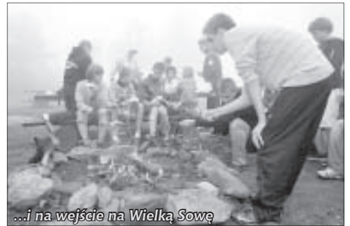
...i na wejście na Wielką Sowę