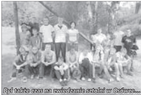
Był także czas na zwiedzanie sztolni w Osówce...