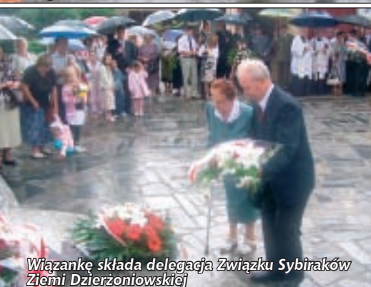
Wiązankę składa delegacja Związku Sybiraków Ziemi Dzierżoniowskiej