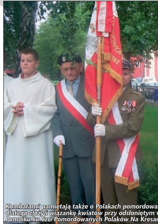
Kombatanów pamiętają także o Polakach pomordowanych dlatego złożyli wiązanke kwiatów przy odsłoniętym w 2006 roku Pomniku ku Czcii Pomordowanych Polaków Na Kresach Wschodnich

„W holdzie Parze Prezydenckiej Lechowi i Państwowej, którzy zginęli w katastrofie lotniczej 10 kwietnia 2010 roku” – tak brzmi napis na odsłoniętej tablicy upamiętniającej ofiary katastrofy samolotu Tu-154.