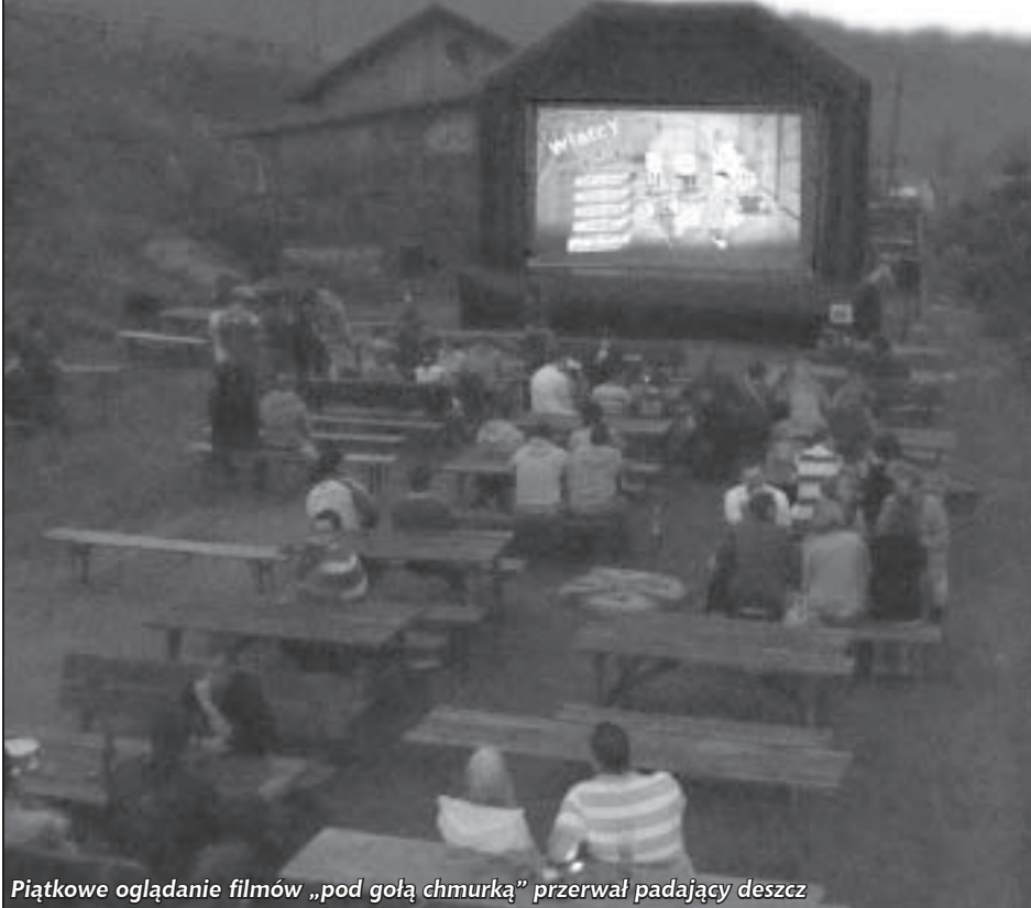
Piątkowe oglądanie filmów „pod gołą chmurką” przerwał padający deszcz

6. Pieszyczy Przegląd Filmowy - jak i wszystkie jego dotychczasowe edycje - gościło Gospodarstwo agroturystyczne „Cicha Woda” z Lasocina.