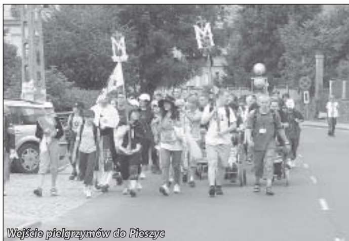
Wejście pielgrzymów do Pieszc