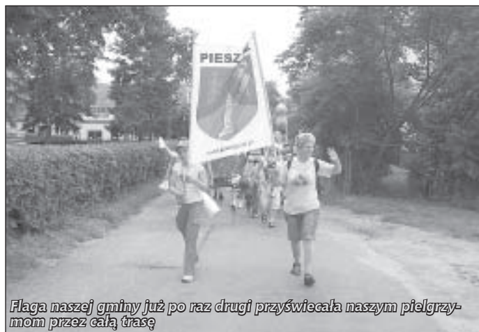
Flaga naszej gminy już po raz drugi przyświecała naszym pielgrzymom przez całą trasę

Przygotowany został pątniczy program formacyjny. Pielgrzymi będą uwrażliwiać się na znaki święte, symbole religijne, kapliczki i krzyże przydrożne, na kościoły, gdzie modlą się ludzie, gdzie sprawowana jest Eucharystia, gdzie udziela się nam Pan Jezus. Dużo będzie o krzyżu w wymiarze duchowym jako cierpieniu i śmierci.