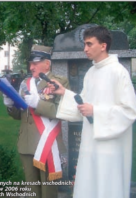
...nych na kresach wschodnich, ...w 2006 roku ...ch Wschodnich

...i Marii Kaczyńskim oraz członkom Delegacji... ...w drodze do Katynia w dniu 10 kwietnia... ...w czasie obchodów Święta Wojska Polskiego... ...olotu Tu-154.