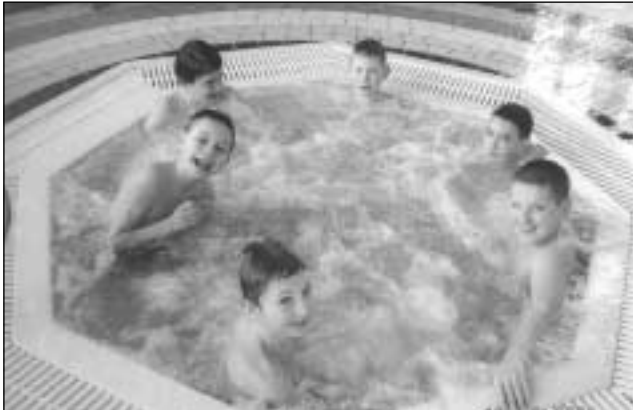
Wizyta w Aquariusie

- konkursy plastyczne, muzyczne i taneczne,