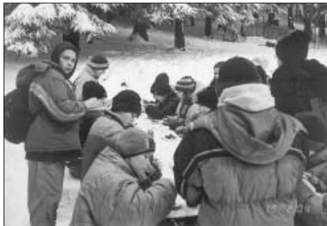
Wycieczka w Góry Sowie

PS. Pragnę gorąco podziękować Ks. Proboszczowi Parafii Św. Antoniego, Ks. Grzegorzowi oraz Ks. Romanowi za zorganizowanie zbiórki żywności dla dzieci z ŚOW. Jednak największe podziękowania składam wszystkim ofiarodawcom.