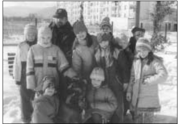
Pies policyjny i my