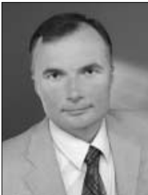
Burmistrz Pieszyc Mirosław Obal