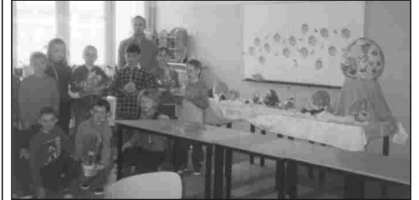
Nasze pisankowe cudenka