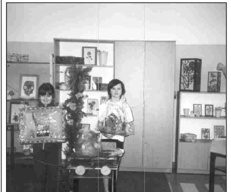
To nasze prace, reprezentujące nas w konkursie