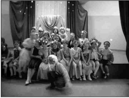
Nasi milusińscy - aktorzy

27 marca na całym świecie obchodzony jest Międzynarodowy Dzień Teatru. Z tej okazji nasz szkolny teatrzyk "Stokrotka" wystąpił z premierą bajki pt. „Księżniczka na ziarnku grochu”. Było to wielkie święto, zarówno dla widzów, jak i aktorów.