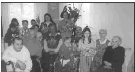
Miło być mocą sprawczą uśmiechu