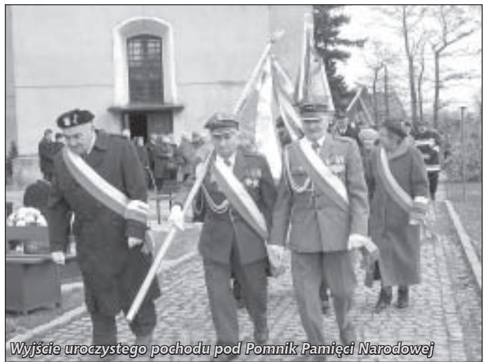
Wyjście uroczystego pochodu pod Pomnik Pamięci Narodowej