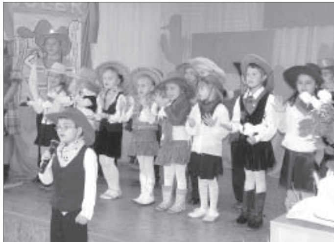
Na zakończenie uroczystości dzieci podziękowały swoim rodzicom piosenką „Cudownych rodziców mam”.

Bolek i Lolek pomagali maluchom zdać egzamin na ucznia. Dzieci śpiewały, mówiły wiersze oraz zatańczyły "Bonanzę". Nagle przyszedł czas na – „ Ślubowanie ”. Wśród pierwszaków chodzą słuchy, narzekają więc maluchy. Powtarzając nie wesoło, ślub będziemy, ślub będziemy brać ze szkołą ... ło, ło. Chciał uciekać Grzesio mały, ale Konrad człek bywały – wytłumaczył mu kolego, ślubowanie to jest całkiem coś innego... ło, ło. Musisz przyrzec, że bez przerwy będziesz dbał o Pani nerwy. Będziesz uczył się starannie, zachowywał nienagannie. Gdy umowa taka stanie, to jest właśnie, to jest właśnie ślubowanie ło, ło... Grzesio wydał kilka jęków, potem już się pozbył lęku i ślubował uroczysto – nos wytarłszy, nos wytarłszy zamaszycie.