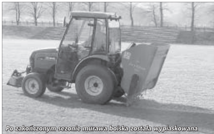
Po zakończonym sezonie murawa boiska została wypiąskowana

MKS Pogoń otrzymał dofinansowanie na bieżącą działalność w roku 2010 w kwocie 55 000zł, jednak na tym się nie zakończyła pomoc dla Klubu. Wśród zadań dodatkowych zrealizowanych