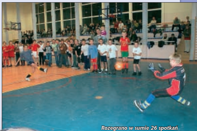
Rozegrano w sumie 26 spotkań

w kategorii „Gimnazjum”. Rozegrano w sumie 26 spotkań.