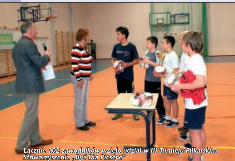
Łącznie 102 zawodników wzięło udział w III Turnieju Piłkarskim Stowarzyszenia „Być Dla Pieszyc”