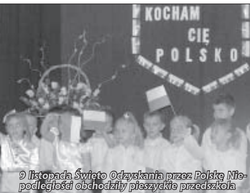
9 listopada Święto Odzyskania przez Polskę Niepodległości obchodzili pieszyckie przedszkola

Ten sam program przedstawiony został pozostałym przedszkolakom