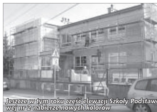
Jeszcze w tym roku część elewacji Szkoły Podstawowej nr 2 nabierze nowych kolorów

W Pieszycach otrzymane pieniądze przeznaczone zostały na remont elewacji Szkoły Podstawowej nr 2. Dodatkowo z budżetu gminy przeznaczono na ten cel kwotę niemal 100 tys. zł. Środki przyznane zostały stosunkowo późno, a należy wykorzystać jeszcze w tym roku, dlatego Urząd Miejski w Pieszycach szybko przystąpił do uruchomienia procedury przetargowej. Dziś już trwają prace, które powinny zostać zakończone jeszcze w tym roku.