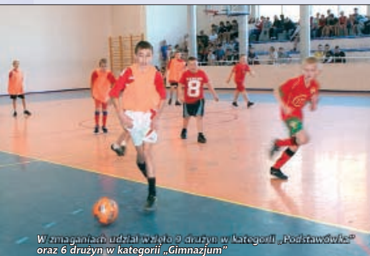
W zmaganiach udział wzięło 9 drużyn w kategorii „Podstawówka” oraz 6 drużyn w kategorii „Gimnazjum”