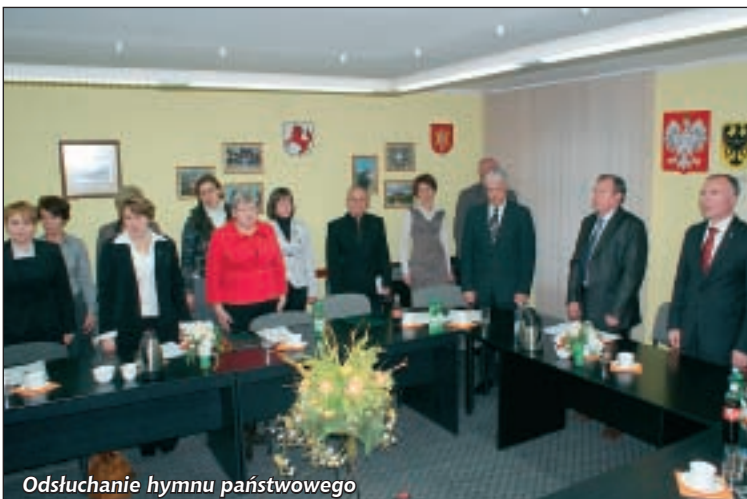
Odsłuchanie hymnu państwowego