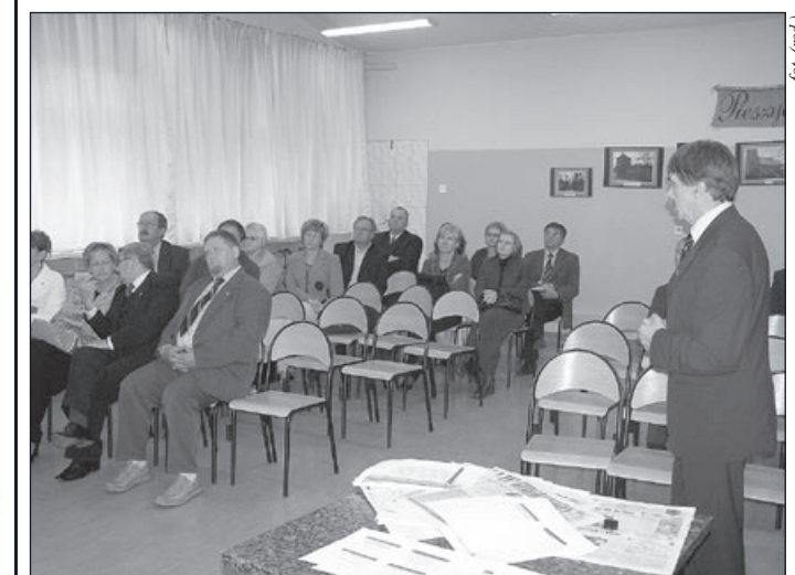
Uczestnikami spotkania byli radni i pracownicy Urzędu