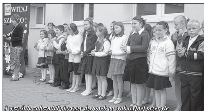
3 września zabrzmiał pierwszy dzwonek po wakacyjnej przerwie

Aby uprzyjemnić i ułatwić nieco przebywanie w murach szkoły w czasie wakacji przeprowadzono szereg remontów. W „jedynce” wykonano remont części dachu, wymieniono płyty regipsowe, odmalowano korytarze i jeden gabinet oraz przełożono kostkę