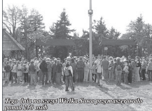
Tęgo dnia na szczycie Wielka Sowa przemaszerowało ponad 250 osób