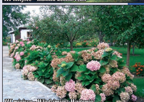
III miejsce - Włodzimierz Wojtania