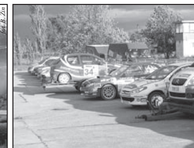
Rajdówki gotowe do boju