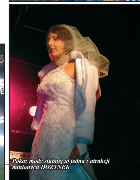
Pokaz mody ślubnej to jedna z atrakcji minionych DOŻYNEK