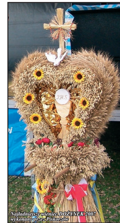
Najładniejszy wieniec DOŻYNEK 2007 wykonany przez Piskorzów