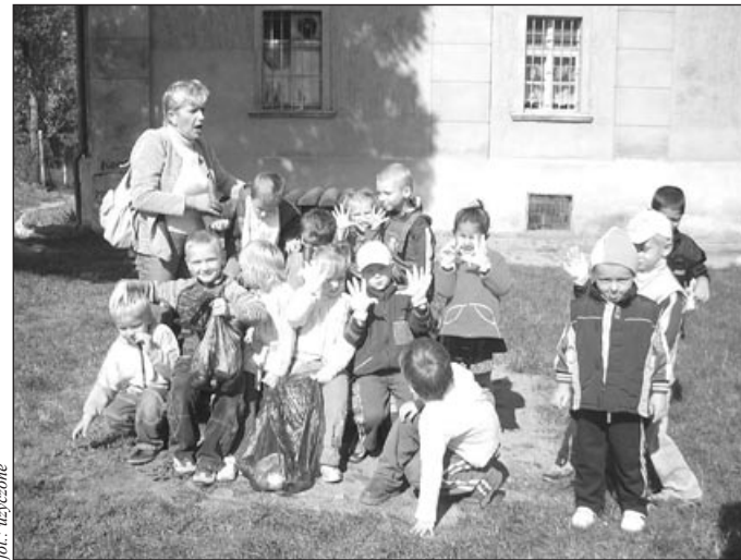
fol. - uszywane

Życzymy wszystkim przedszkolakom, by chwile spędzone w przedszkolu dostarczały im wielu niezapomnianych, miłych wrażeń.