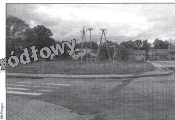
W tym miejscu ma powstać jeden z supermarketów

W interpelacji radni proszą Burmistrza Mirosława Obal o wyjaśnienie, dlaczego: - tak ważna decyzja, co prawda zmieniająca już nieaktualny plan przestrzennego zagospodarowania (w/w plan przewidywał na działce 140/3 obok Pieszycy Środkowej