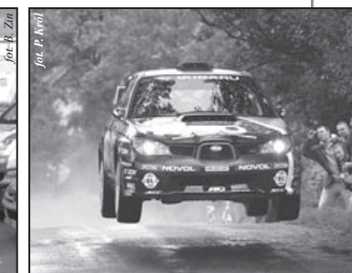
Efektowne skoki – to tygryski lubią najbardziej