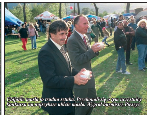
Ubijanie masła to trudna sztuka. Przekonali się o tym uczestnicy konkursu na najszybsze ubicie masła. Wygrał burmistrz Pieszyc