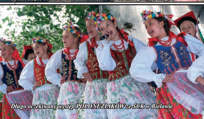
Długo oczekiwany występ POLONEZIAKÓW ze SCK w Bielawie