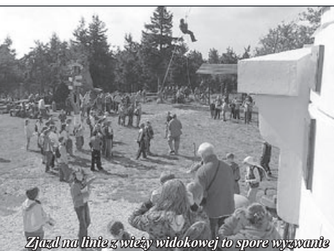
Zjazd na linie z wieży widokowej to spore wyzwanie

Na szczycie zorganizowano drużynowy turniej przeciągania liny, w którym