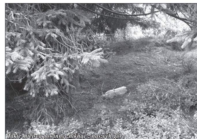
Takie miejsca powinny zniknąć z naszych gór

Działania te objęły około 170 uczniów i 50 osób dorosłych (w tym nauczycieli i rodziców) oraz 200 mieszkańców , którym rozdano ulotki informacyjne.