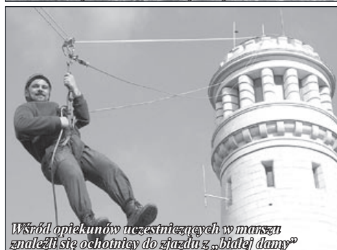
Wśród opiekunów uczestniczących w marszu znaleźli się ochotnicy do zjazdu z „białej dąmy”