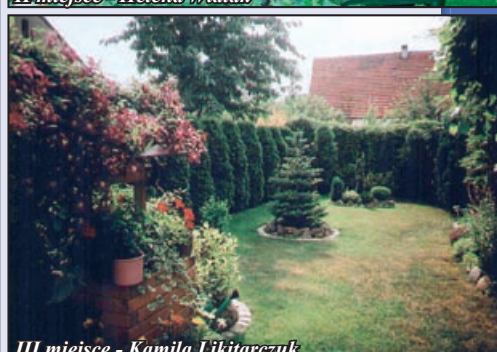
III miejsce - Kamila Likitarczuk