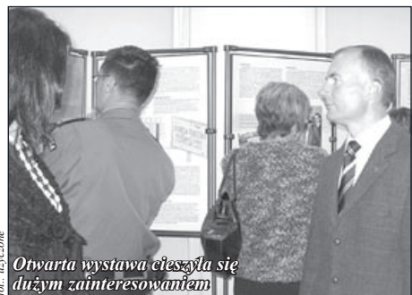
Otwarta wystawa cieszyła się dużym zainteresowaniem