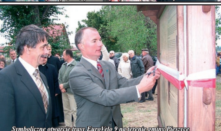
Symboliczne otwarcie trasy EuroVelo 9 na terenie gminy Pieszycy