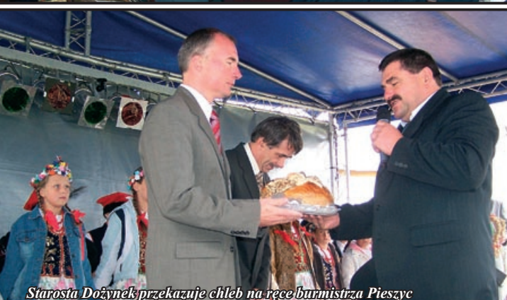
Starosta Dożynek przekazuje chleb na ręce burmistrza Pieszyc