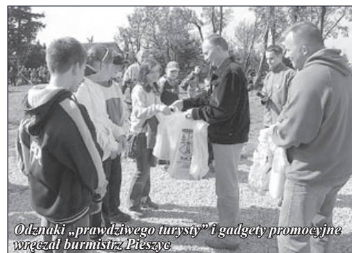
Odnaki „prawdziwego turysty” i gadgety promocyjne wręczał burmistrz Pieszyce