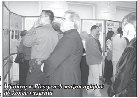
Wystawę w Pieszycach można oglądać do końca września

Historycznie Fundacja wywodzi się z powstałej w połowie lat 80-tych Solidarności Polsko-Czechosłowackiej – forum współpracy opozycji demokratycznej tych krajów. Właśnie jej wieloletni członek