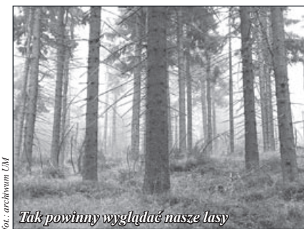
Tak powinny wyglądać nasze lasy

nego przez Lasy Państwowe oraz Prezesa Towarzystwa Przyjaciół Lasu.