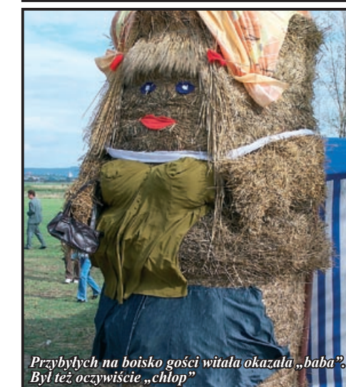
Przybyłych na boisko gości witała okazała „baba”. Był też oczywiście „chłop”