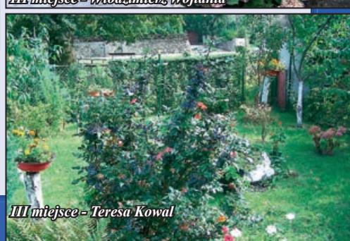
III miejsce - Teresa Kowal