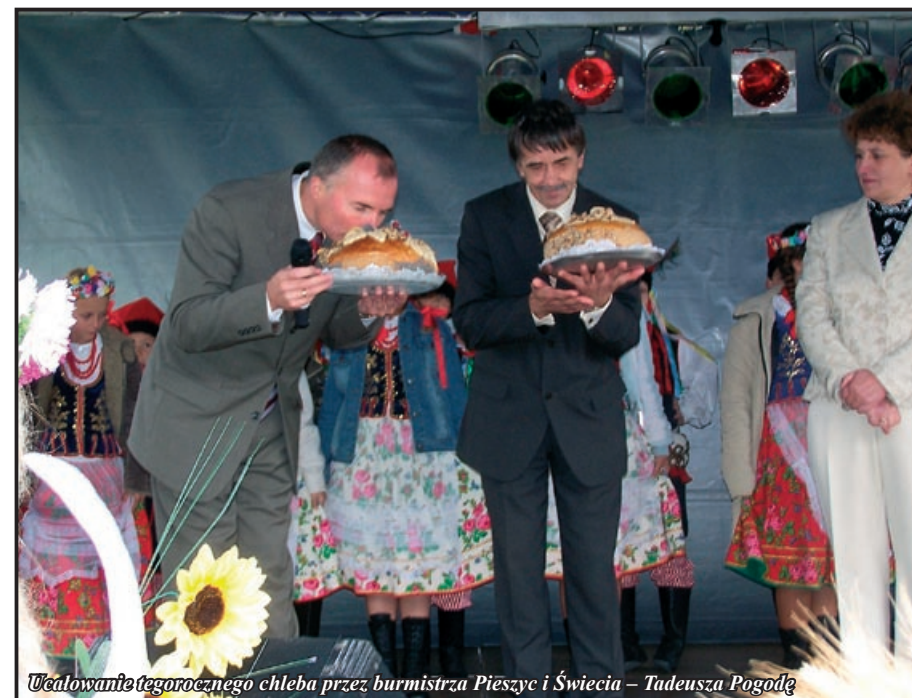
Uciętowanie tegorocznego chleba przez burmistrza Pieszyc i Świecia – Tadeusza Pogodę