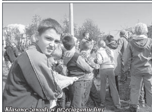
Klasowe zawody w przeciąganiu liny