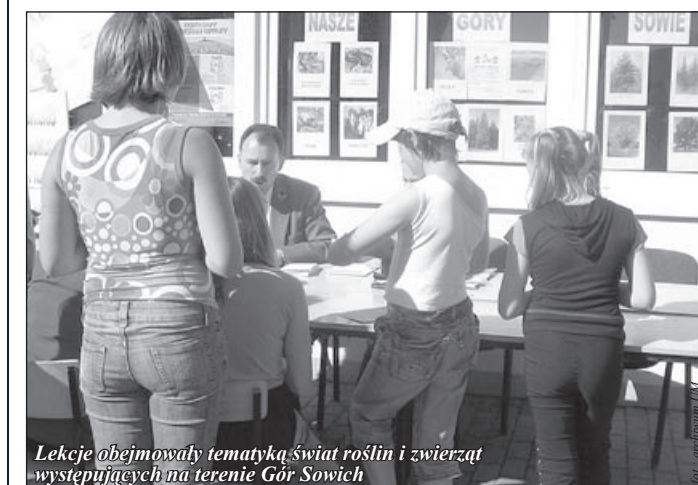
Lekcje obejmowały tematykę świat roślin i zwierząt występujących na terenie Gór Sowich

Pod koniec czerwca szczegółowe sprawozdania z akcji zostały przekazane do Nadleśnictwa Świdnica, które po zaopiniowaniu przekazało do Dyrekcji Regionalnej Lasów Państwowych we Wrocławiu. Regionalna komisja konkursowa ocenia nadesłane prace i wylania uczestników finału. Najlepsze prace zostaną przekazane do Warszawy do centralnej komisji konkursowej.