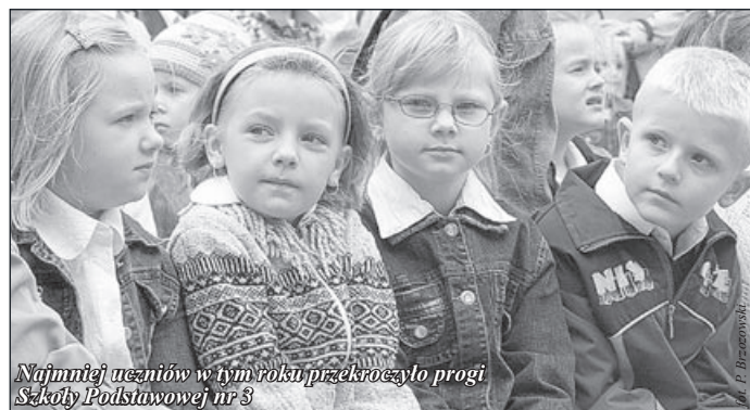
Najmniej uczniów w tym roku przekroczyło prógi Szkoły Podstawowej nr 3

Najwięcej, bo aż 364 uczniów rozpoczęło uroczyste naukę w Szkole Podstawowej nr 1. Wśród nich znajduje się 60 pierwszoklasistów. W „dwójce” uczy się 115 dzieci, w tym