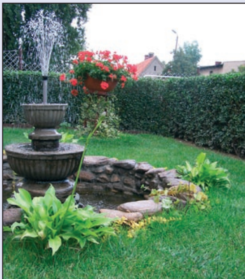
I miejsce - Władysława Kordiała