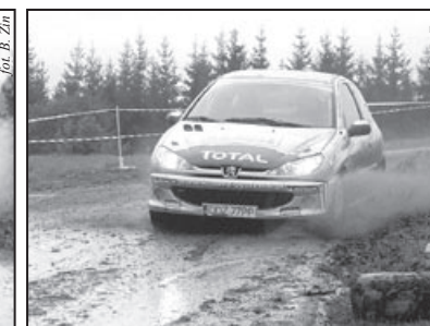
Duży pech braci Dobrowolskich, którzy po 1 etapie wyraźnie prowadzili w Pucharze