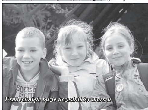
Uśmiechnięte buzie uczestników marszu