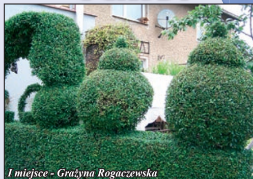
I miejsce - Grażyna Rogaczewska