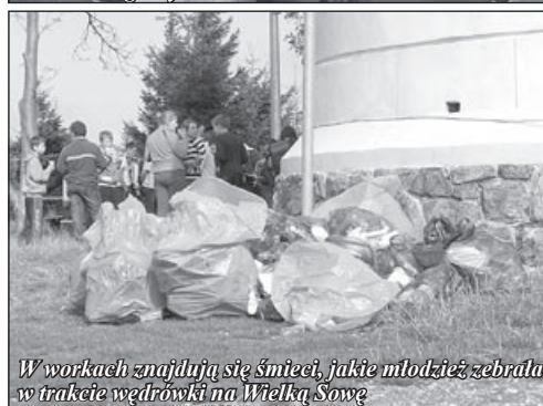
W workach znajdują się śmieci, jakie młodzież zebrała w trakcie wędrówki na Wielką Sowę