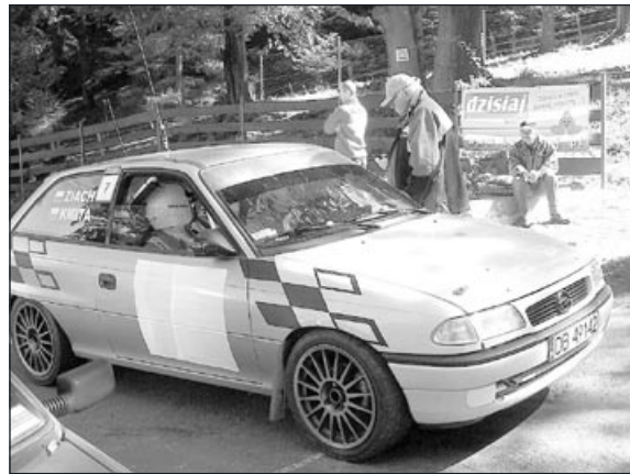
Paweł Kmita i Bartłomiej Ziach ruszają po drugie miejsce w klasie V