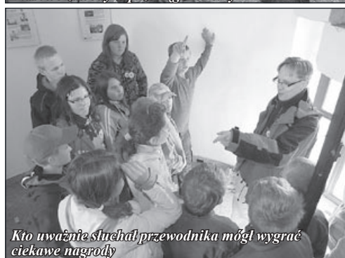
Kto uważnie słuchał przewodnika mógł wygrać ciekawe nagrody