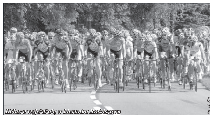
Kolarze wyjeżdżają w kierunku Rożniewa

Przed rozpoczęciem szóstego etapu tegorocznego Tour de Polotne w Rynku w Dzierżoniowie odbyła się swoista kolarska feta.