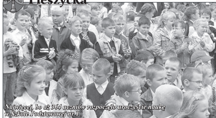
Najwięcej, bo aż 364 uczniów rozpoczęło uroczyste naukę w Szkole Podstawowej nr 1