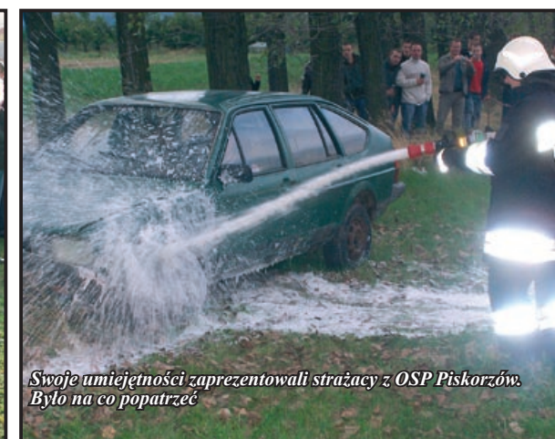
Swoje umiejętności zaprezentowali strażacy z OSP Piskorzów. Było na co popatrzeć