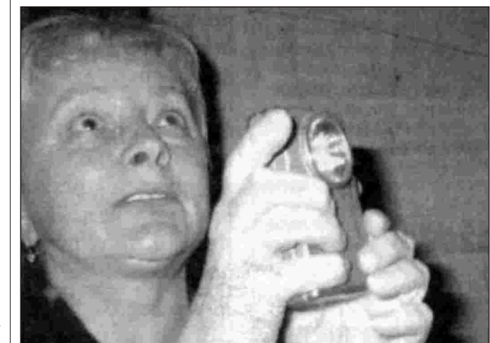
fol. ze Słowa Polskiego Gazety Wrocławskiej

Kontrola budynku mieszkalnego w Rościszowie, przeprowadzona dnia 26 czerwca 2003 wykazała zajmowanie strychu przez liczną kolonię rozrodzanej noka dużego Myotis myotis (Borkhausen, 1797). Gatunek ten, podobnie jak i pozostałe nietoperze podlega, w naszym kraju ochronie prawnej na mocy Rozporządzenia Ministra Środowiska o Ochronie Gatunkowej Zwierząt, a także podpisanych przez Polskę porozumień międzynarodowych - Konwencji Berneńska, Konwencji Dońskiej, oraz Porozumienia o Ochronie Nietoperzy w Europie. Ponad to nocoł duży jest jednym z gatunków priorytetowych przy wyznaczaniu sieci ostoju w programie Natura 2000, realizowanym we wszystkich krajach Unii Europejskiej zgodnie z Dyrektywą