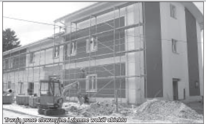
Trwają prace elewacyjne i ziemne wokół obiektu