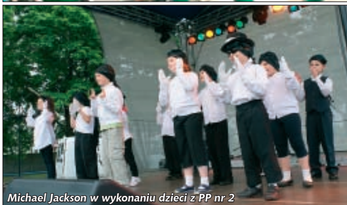
Michael Jackson w wykonaniu dzieci z PP nr 2