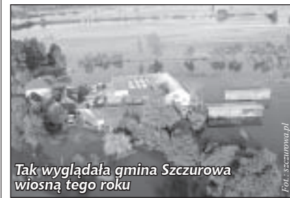
Tak wyglądała gmina Szczurowa wiosną tego roku