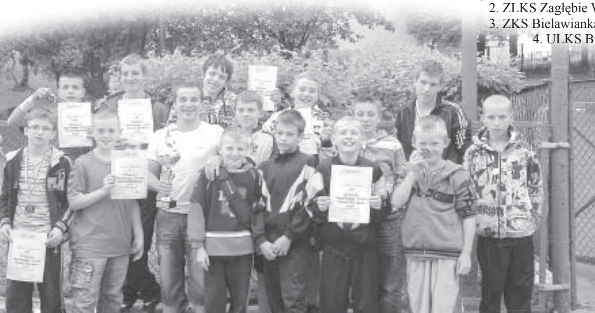
Na wspólnym zdjęciu zawodnicy SOWY Pieszycę i JUNIORA Dzierżoniów