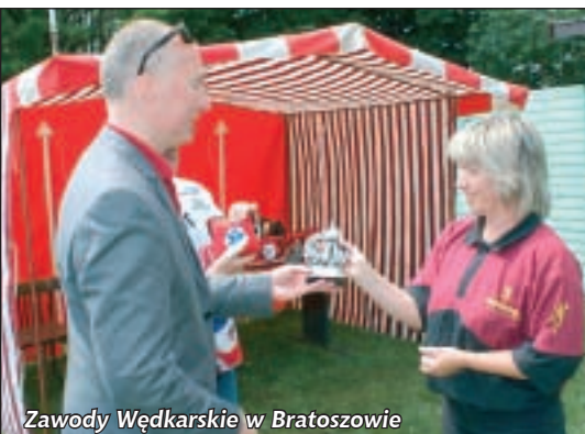
Zawody Wędkarskie w Bratoszowie