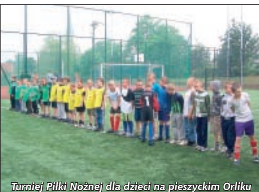
Turniej Piłki Nożnej dla dzieci na pieszyckim Orliku