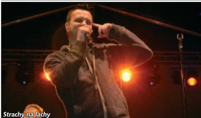
Strachy na lachy

Rockowo i na sportowo... takim hasłem można podsumować dni Pieszyc, które odbyły się w dniach 19-20 czerwca. Jednak nie do rozpoczęły się już w czwartek 17 czerwca, kiedy to na sali sportowej zmagania w Turnieju Tenisa Stołowego rozpoczęły 34 osoby rywalizujące. Równolegle na Orliku rozgrywany był Otwarty Turniej Piłkarski. Tuż przed rozpoczęciem imprez odbyły się zawody w badmintonie, w których wzięło udział ponad 60 zawodników.