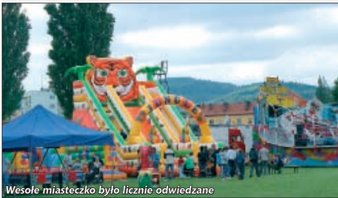
Wesołe miasteczko było licznie odwiedzane