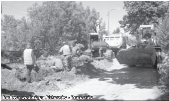
Budowa wodociągu Piskorzów - Bratoszów