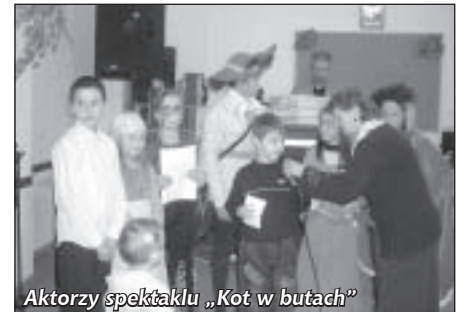
Aktorzy spektaklu „Kot w butach”