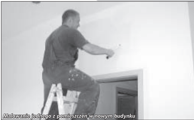
Malowanie jednego z pomieszczeń w nowym budynku

Trwają intensywne prace przy budowie nowej siedziby Przychodni Miejskiej w Pieszycach. W ostatnim czasie wykonane zostały najbardziej widoczne prace elewacyjne. We wnętrzu budynku układana jest glazura i terrakota. Obieście przygotowywane jest do utwardzenia nawierzchni. Ale... - spojrzmy na fotografie.