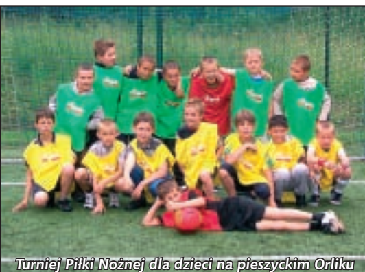
Turniej Piłki Nożnej dla dzieci na pieszyckim Orliku