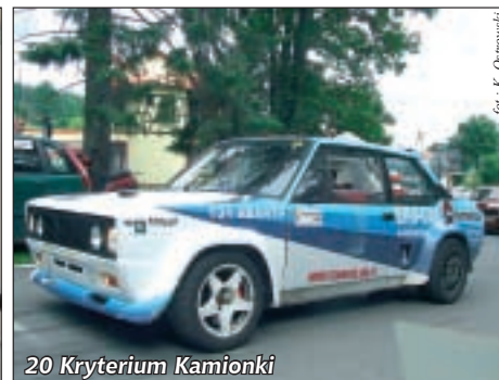
20 Kryterium Kamionki