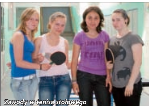
Zawody w tenisa stołowego