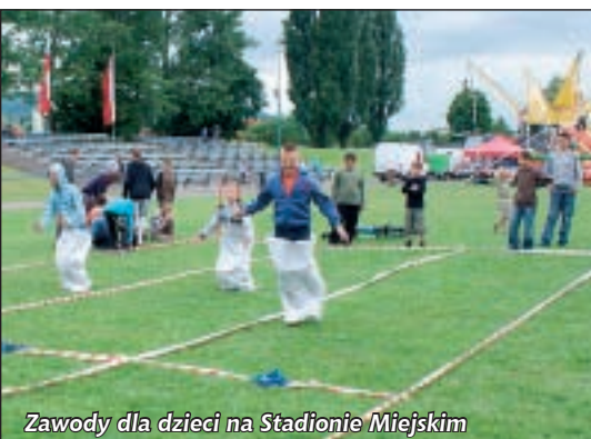
Zawody dla dzieci na Stadionie Miejskim