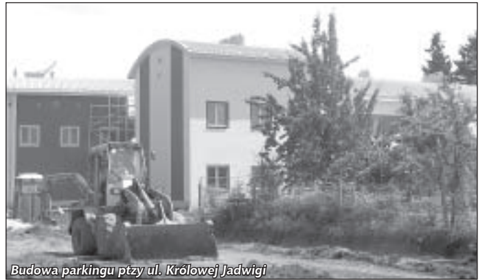
Budowa parkingu przy ul. Królowej Jadwigi