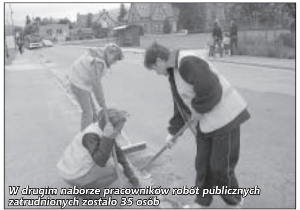
W drugim naborze pracowników robót publicznych zatrudnionych zostało 35 osób

barier przy potokach, naprawa i malowanie wiat przystankowych znajdujących się na terenie gminy Pieszycy, dbałość o porządek w parkach miejskich oraz porządkowanie terenu wokół wieży widokowej na Wielkiej Sowie. Część pracowników zostanie także oddelegowana do placówek oświatowych działających w gminie oraz do Zakładu Gospodarki Mieszkaniowej.