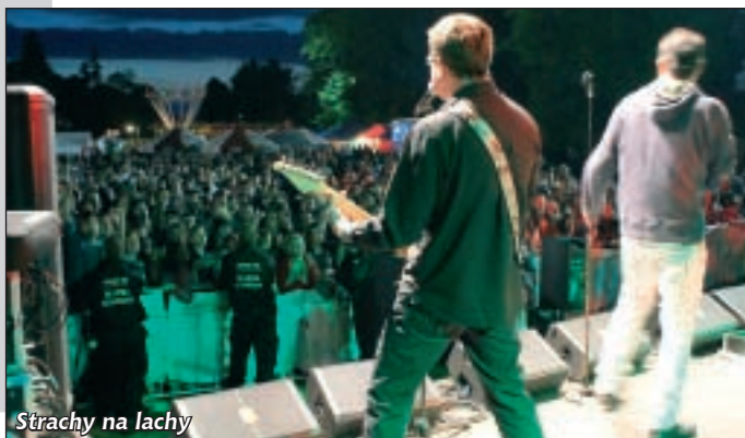
Strachy na lachy