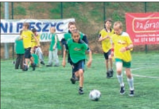
Turniej Piłki Nożnej dla dzieci na pieszyckim Orliku