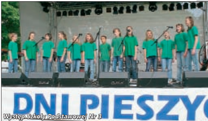
Występ Szkoły Podstawowej Nr 3