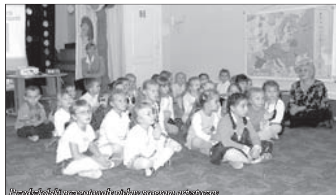
Przedkololki przygotowały piękny program artystyczny

Napięty program pobytu i bezpośredni kontakt z dyrektorami placówek prowadzonych przez gminę Świecie umożliwił zapoznanie się z zasadami funkcjonowania i finansowania zarówno przedszkoli jak i szkół podstawowych.