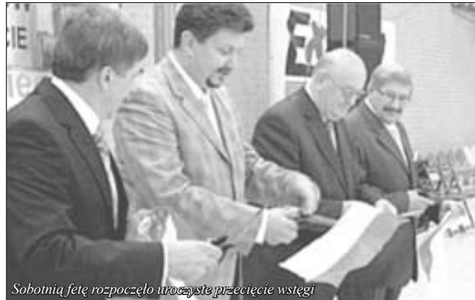
Sobotnią fetę rozpoczęło uroczyste przecięcie wstęgi

Po półtorarocznej budowie świeciańskie mogli w sobotę zobaczyć od wewnątrz halę widowiskowo - sportową. Było uroczyste i podniosłe, chociaż nie obyło się bez małego zgrzytu.