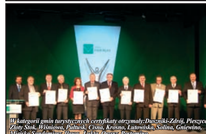
W kategorii gmin turystycznych certyfikaty otrzymały: Duszniki-Zdrój, Pieszyce, Złoty Stok, Wiśniowa, Pultusk, Cisna, Krosno, Lutowska, Solina, Gniewino, Miejska Sandomierz, Ilawa, Łukta, Orzysz, Postomino