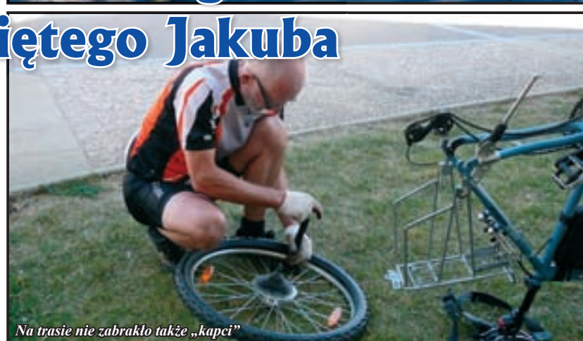
Na trasie nie zabrakło także „kapci”