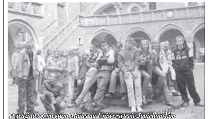
Dziękuję Collegium Maius na Uniwersytecie Jagiellońskim

Oprócz miejsc pamięci narodowej młodzież mogła także podziwiać piękne krajobrazy Jury Krakowsko-Częstochowskiej. W programie wycieczki znalazło się także zamków w Ogrodzieńcu, Pieskowej Skale i w Ojcowie, a także Groty Łokietka.