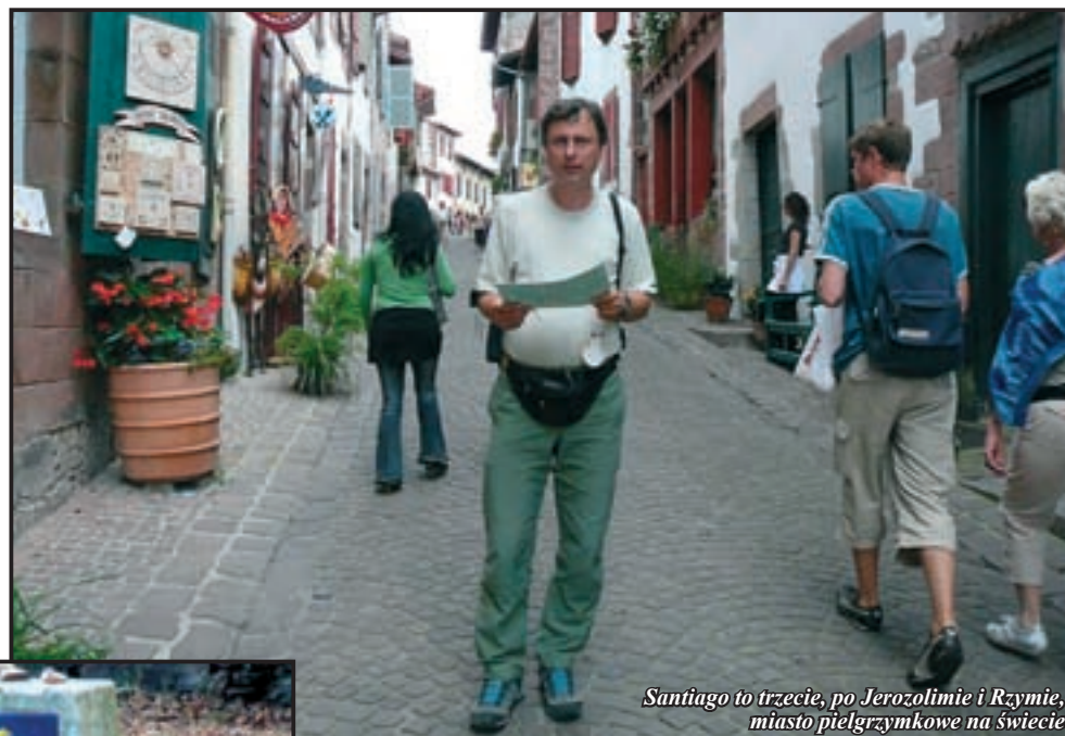
Santiago to trzecie, po Jerozolimie i Rzymie, miasto pielgrzymkowe na świecie