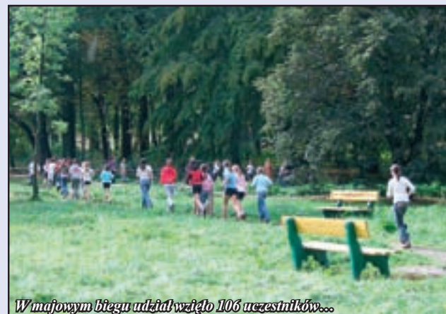
W majowym biegu udział wzięło 106 uczestników...