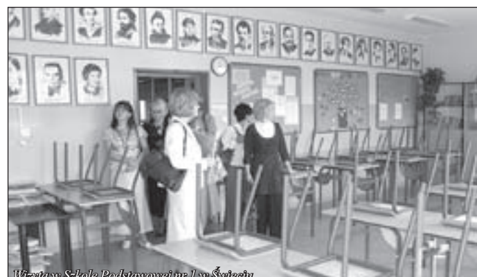
Wizyta w Szkole Podstawowej nr 1 w Świeciu

Wizyta dyrektorów z pieszyckich placówek oświatowych w Świeciu była także znakomitą okazją do poznania atrakcji turystycznych, jakie