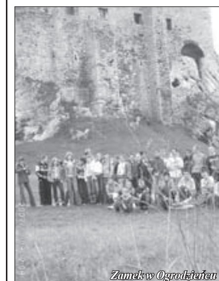
Zamek w Ogrodzieńcu

Wycieczka, w której wzięła udział nasza młodzież, dofinansowana była przez MENiS w ramach programu „Podróże historyczno-kulturowe w czasie i przestrzeni”. Zgłoszenie do konkursu oraz plany wycieczki