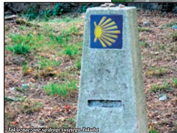
Tak oznaczone są drogi świętego Jakuba