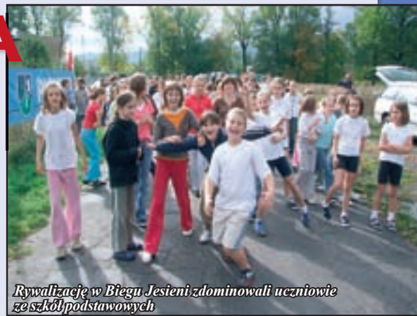
Rywalizację w Biegu Jesieni zdominowali uczniowie ze szkół podstawowych