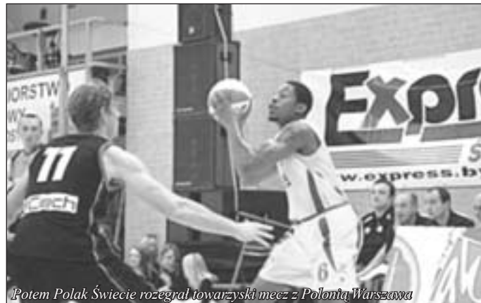
Potem Polak Świecie rozegrał towarzyski mecz z Polonią Warszawa