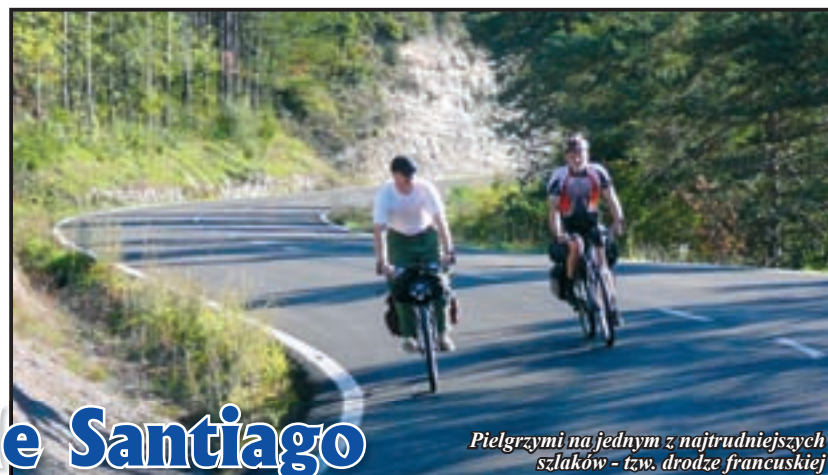
Pielgrzymi na jednym z najtrudniejszych szlaków - tzw. drodze francuskiej