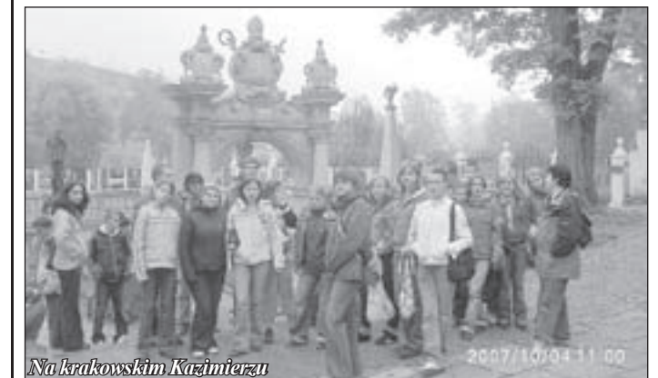
Na krakowskim Kazimierzu

W dniach od 3 do 5 października młodzież z Gimnazjum Zespołu Szkół brała udział w „historycznej wyprawie na Kraków i okolice”. 45-ciu uczniów z klas II c i II b miało okazję zobaczyć Kraków oraz zwiedzić istotne dla naszej historii miejsca pamięci narodowej.