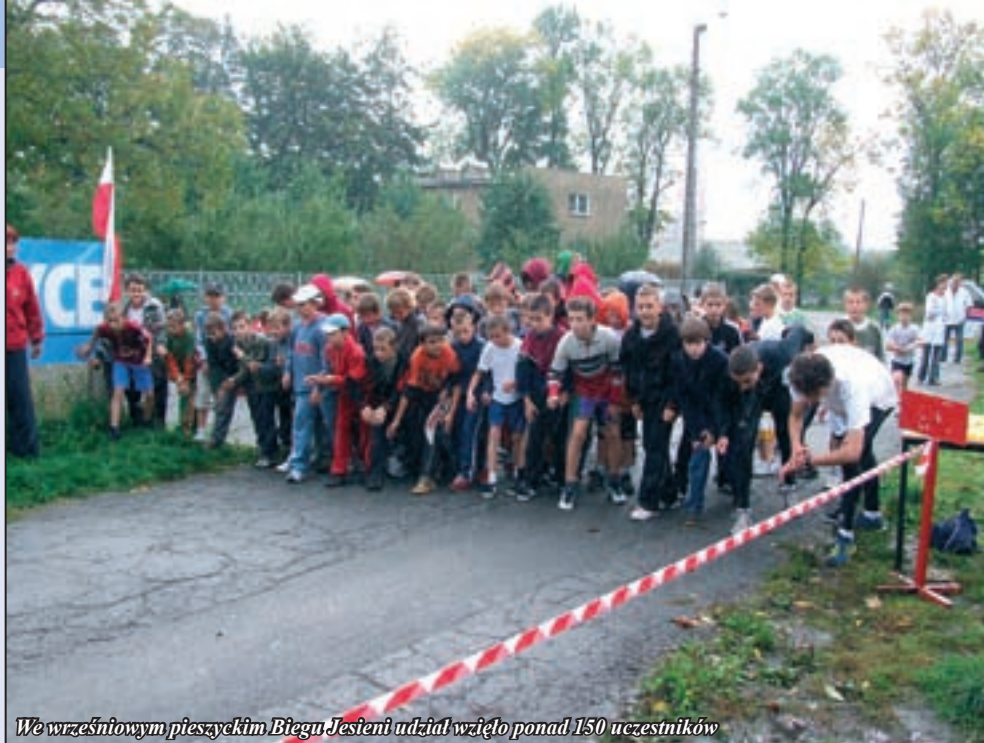
We wrześniowym pieszyckim Biegu Jesieni udział wzięło ponad 150 uczestników

Wyznaczona w parku uniwersalna trasa sprawiała, że dobrze się na niej czuli zarówno starsi zawodnicy startujący w kategorii OPEN, jak i młodzi ze szkół podstawowych. Szkoda, że nie dopisali gimnazjaliści, ale to być może wynikało ze strachu przed przegraną z zawodnikami z pieszyckich podstawówek. Nieco kapryśna była także pogoda, ale młodzi sportowcy pokazali, że nie są „z cukru” i bez obaw wystartowali do pokonania blisko 2-kilometrowej trasy. Po wysiłku na każdego uczestnika czekała gorąca grochówka i imienne dyplomy, a dla najlepszych puchary i nagrody.