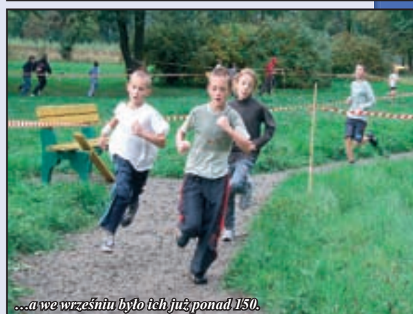
...a we wrześniu było ich już ponad 150.