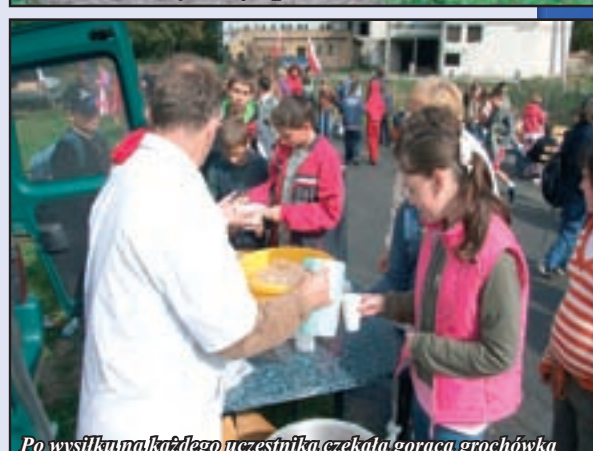
Po wysiłku na każdego uczestnika czekała gorąca grochówka