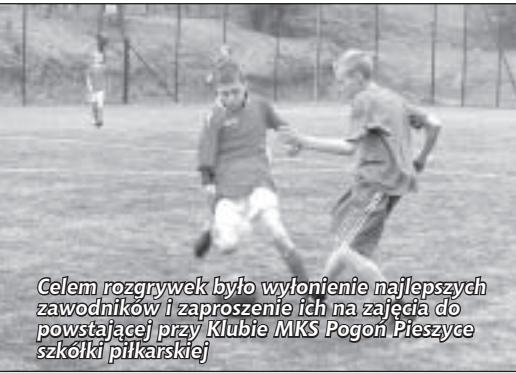
Celem rozgrywek było wyłonienie najlepszych zawodników i zaproszenie ich na zajęcia do powstającej przy Klubie MKS Pogoń Pieszycze szkółki piłkarskiej

4 maja br. na „Orliku” pod hasłem „Pogoń Cup Majówka 2010” odbył się