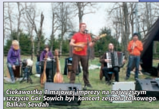
Ciekawostką 1 majowej imprezy na najwyższym szczycie Gór Sowich był koncert zespołu folkowego Balkan Sevdah

którego występ zakończyła nauka tańca bałkańskiego. Jest to pierwsze tego typu wydarzenie w tym miejscu. Kto nie mógł zobaczyć i posłuchać zespołu, będzie miał taką okazję podczas Dni Pieszyce - 20 czerwca, gdzie zagrają ponownie.