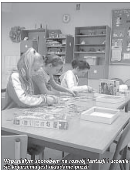
Wspaniałym sposobem na rozwój fantazji i uczenie się kojarzenia jest układanie puzzli

Na świetlicę środowiskową przy Szkole Podstawowej nr 3 zapisanych jest 14 dzieci