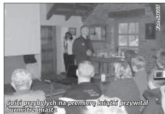
Gości przybyłych na premierę książki przywitał burmistrz miasta

Książkę można nabyć w Miejskiej Bibliotece Publicznej – Centrum Kultury w Pieszycach: MBP-CK w Pieszycach, ul. Mickiewicza 10 (I piętro – wypożyczalnia dla dorosłych), 58-250 Pieszycy.