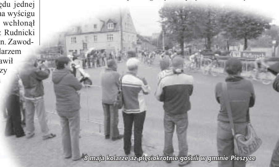
8 maja kolarze aż pięciokrotnie gościli w gminie Pieszycze

na podst. grody.com.pl, fot.: UM Pieszycze