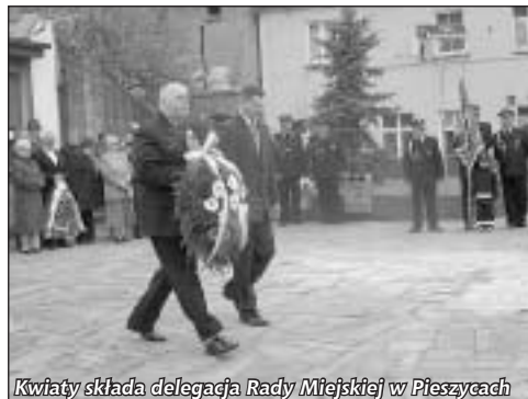
Kwiaty składa delegacja Rady Miejskiej w Pieszcach