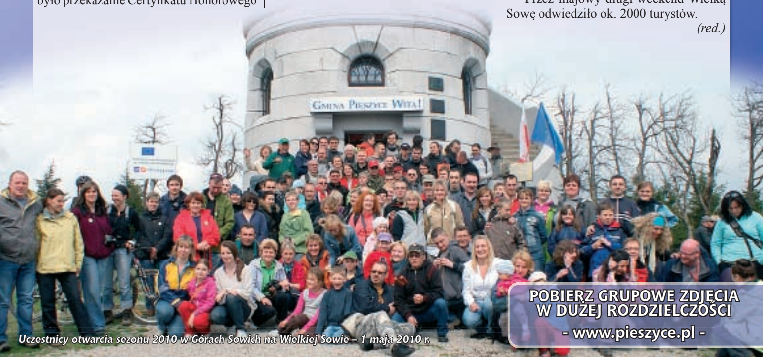
Uczestnicy otwarcia sezonu 2010 w Górach Sowich na Wielkiej Sowie – 1 maja 2010 r.

POBIERZ GRUPOWE ZDJĘCIA W DUŻEJ ROZDZIELCZOŚCI