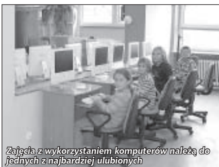
Zajęcia z wykorzystaniem komputerów należą do jednych z najbardziej ulubionych

świetlicy środowiskowej dzieci również nauczyły się, że trzeba odrabiać zadania domowe i przychodząc na świetlicę same