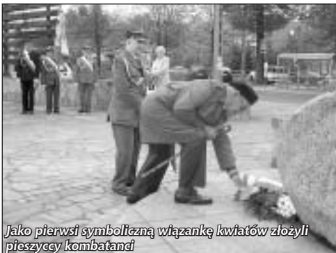
Jako pierwsi symboliczną wiązanek kwiatów złożyli pieszczyccy kombatanci