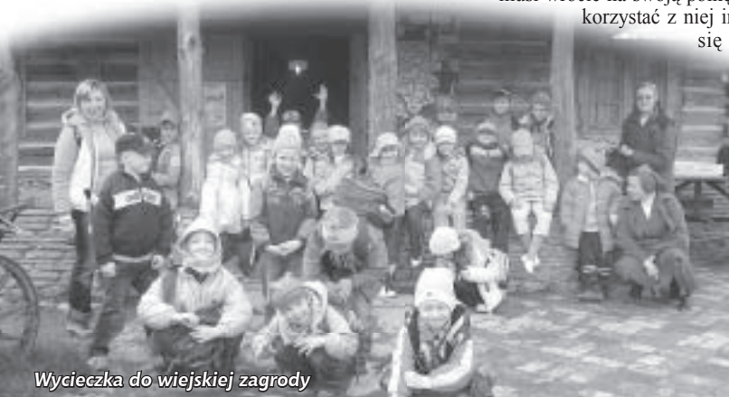
Wycieczka do wiejskiej zagrody

Dnia 11.06 odbędzie się w ogrodzie przedszkolnym Festyn Rodzinny. Oferujemy: dobrą zabawę przy muzyce, loterię fantową, kielbaski z grilla, pyszne ciasta, kawę i herbatę, konkursy. ZAPRASZAMY.