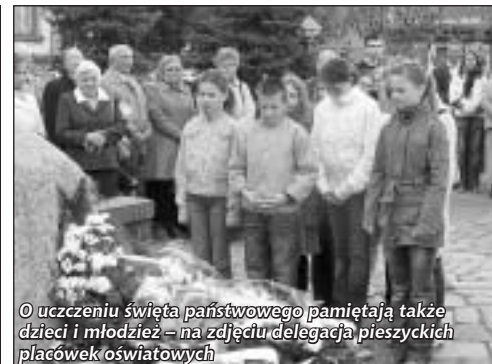
© uczczeniu święta państwowego pamiętają także dzieci i młodzież – na zdjęciu delegacja pieszczyckich placówek oświatowych