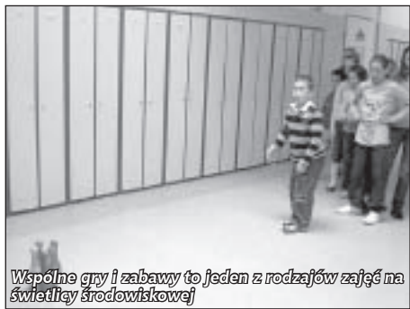
Wspólne gry i zabawy to jeden z rodzajów zajęć na świetlicy środowiskowej

Ze świetlicy działającej przy Szkole Podstawowej Nr 1 korzystała grupa 31 uczniów z klas I – VI. Stałą grupę stanowiło 25 uczniów, pozostali uczniowie to osoby korzystające z opieki sporadycznie, najczęściej oczekujące na zajęcia popołudniowe czy basen.