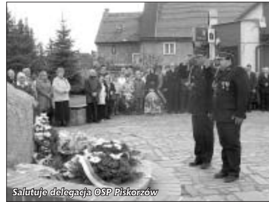
Salutuje delegacja OSP Piskorzów