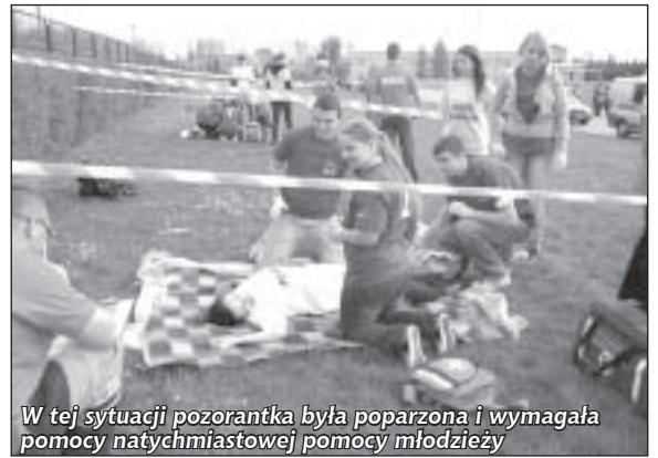
W tej sytuacji pozorantka była poparzona i wymagała pomocy natychmiastowej pomocy młodzieży

Drugie miejsce przypadło II Liceum Ogólnokształcącemu w Dzierżoniowie im. Jana Pawła II, a trzecią lokatę zajął Zespół Szkół nr 1 im.