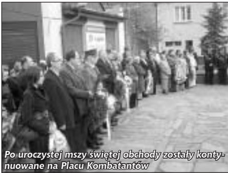
Po uroczystej mszy świętej obchody zostały kontynuowane na Placu Kombatantów