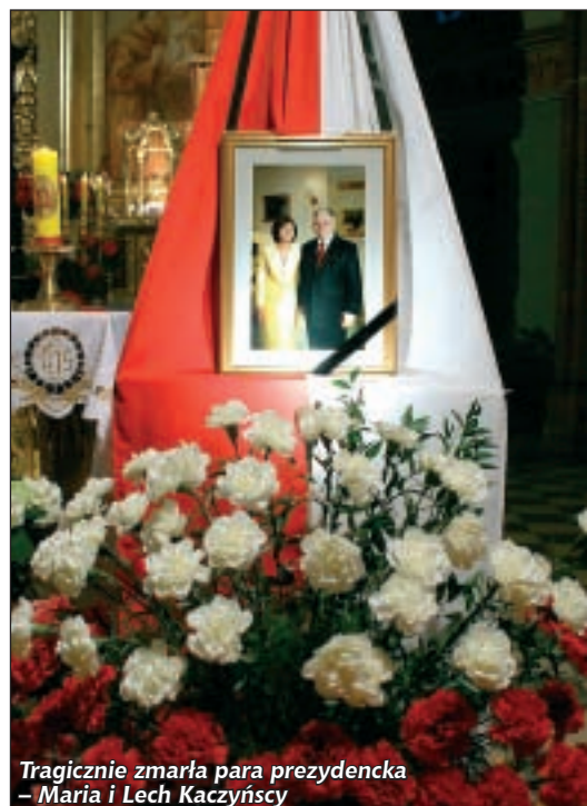
Tragicznie zmarła para prezydencka – Maria i Lech Kaczyńscy