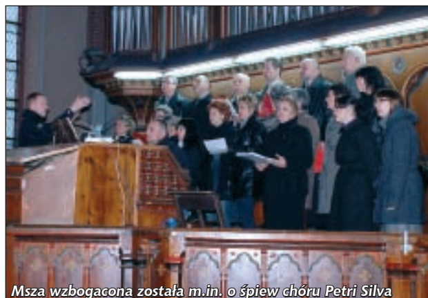
Msza wzbogacona została m.in. o śpiew chóru Petri Silva