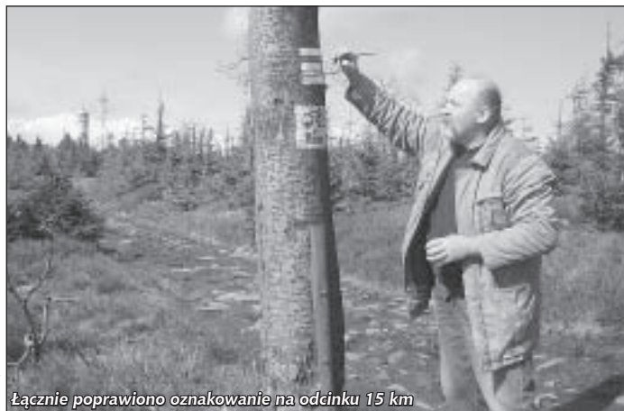
Łącznie poprawiono oznakowanie na odcinku 15 km