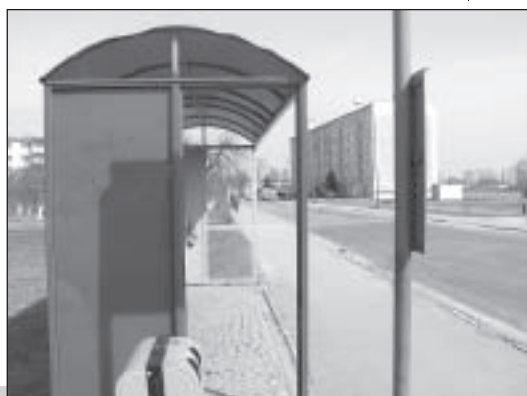
Jeżeli szkoda nie przekracza 250 zł wówczas jest to wykroczenie i zgodnie z art. 124 kw. sprawca podlega karze aresztu, ograniczenia wolności lub grzywny. Ponadto można orzec obowiązek zapłaty równoważności wyrządzonej szkody lub obowiązek przywrócenia do stanu poprzedniego. Jeżeli szkoda przekracza 250 zł jest to przestępstwo - art. 288 §1. Sprawca podlega karze pozbawienia wolności od 3 miesięcy do lat 5