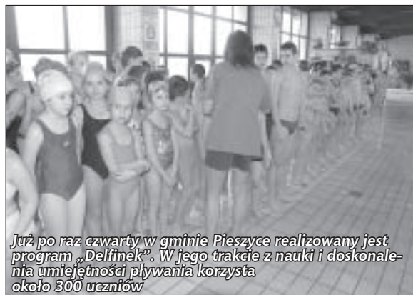
Już po raz czwarty w gminie Pieszyce realizowany jest program „Delfinek”. W jego trakcie z nauki i doskonalenia umiejętności pływania korzysta około 300 uczniów

Zespół Obsługi Szkół i Przedszkoli w Pieszcach przy współpracy UM Pieszyce. (red.)