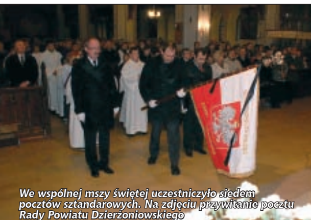
We wspólnej mszy świętej uczestniczyło siedem pocztów sztandarowych. Na zdjęciu przywitanie poczty Rady Powiatu Dzierżoniowskiego