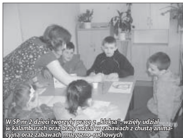
W SP nr 2 dzieci tworzyły pracę z „kleksa”, wzięły udział w kalamburach oraz brały udział w zabawach z chustą animacyjną oraz zabawach muzyczno-ruchowych

pierwszej pomocy, które prowadził Mateusz Urban . W krótkim czasie powstawały fantastyczne, głębokie, przemyślane plakaty – świadomy apel o zdrowy tryb życia, zaś na zajęciach praktycznych ogromny