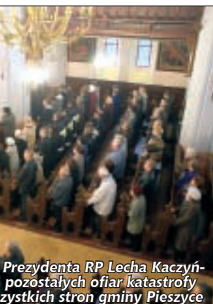
Prezydenta RP Lecha Kaczyńskiego pozostałych ofiar katastrofy wszystkich stron gminy Pieszycy