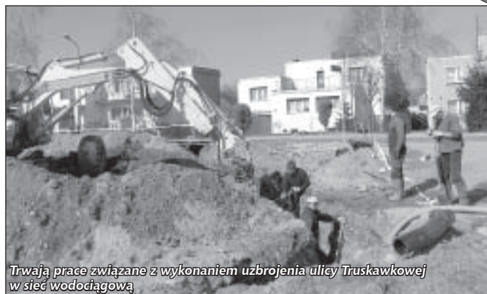
Trwają prace związane z wykonaniem uzbrojenia ulicy Truskawkowej w sieć wodociągową