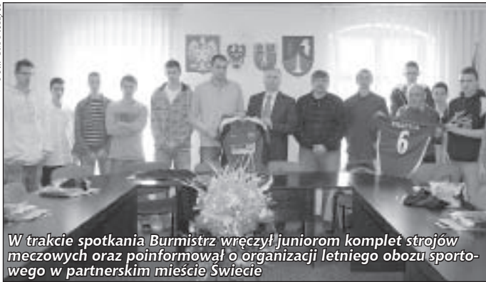
W trakcie spotkania Burmistrz wręczył juniorom komplet strojów meczowych oraz poinformował o organizacji letniego obozu sportowego w partnerskim mieście Świecie