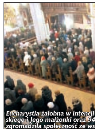
Eucharystia żałobna w intencji Lecha Kaczyńskiego i Jego małżonki oraz 94 zgrupowała społeczność ze ws