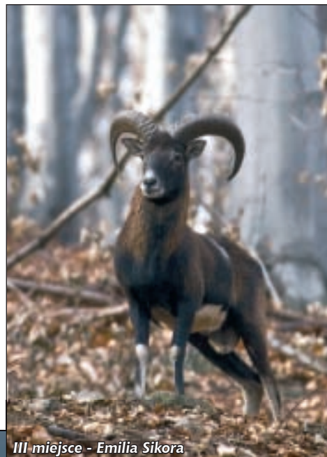
III miejsce - Emilia Sikora