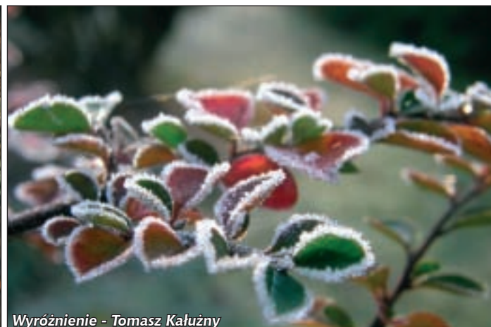
Wyróżnienie - Tomasz Kałużny