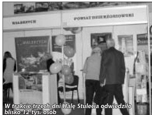
W trakcie trzech dni Hali Stulecia odwiedziło blisko 12 tys. osób

Ze względu na zróżnicowane ukształtowanie terenu oraz wiele atrakcji m.in. takich jak Arboretum w Wojsławicach czy