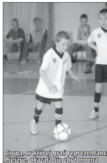
Grupa, w której grali reprezentanci Pieszyc, okazała się zbyt mocna