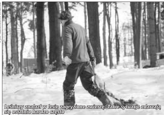
Leśnicy znaleźli w lesie zagryzione zwierzę. Takie sytuacje zdarzają się ostatnio bardzo często

Do wszystkich wójtów i starostów z terenu świdnickiego nadleśnictwa wysłano już petycję z prośbą o pomoc i zdyscyplinowanie gospodarzy, którzy wypuszczają psy bez kagańców i smyczy poza swoje posesje. Leśnicy ostrzegają, że dla właścicieli puszcanych luzem psów nie będzie litości. Każdy, kto złamie