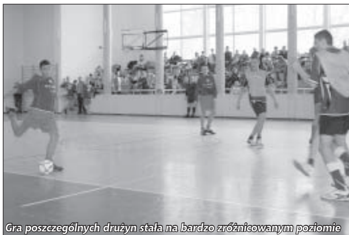
Gra poszczególnych drużyn stała na bardzo zróżnicowanym poziomie

W zmaganiach udział wzięło 300 młodych futbolistów z trzynastu Salezjańskich Stowarzyszeń