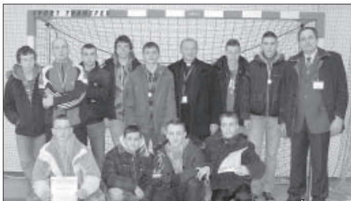
Dzierżoniowscy futsaliści w meczu grupowym przegrali ze Świętochłowicami 1:3, lecz w pojedynku o trzecie miejsce zrewanżowali się im z nawiązką wygrywając 9:3