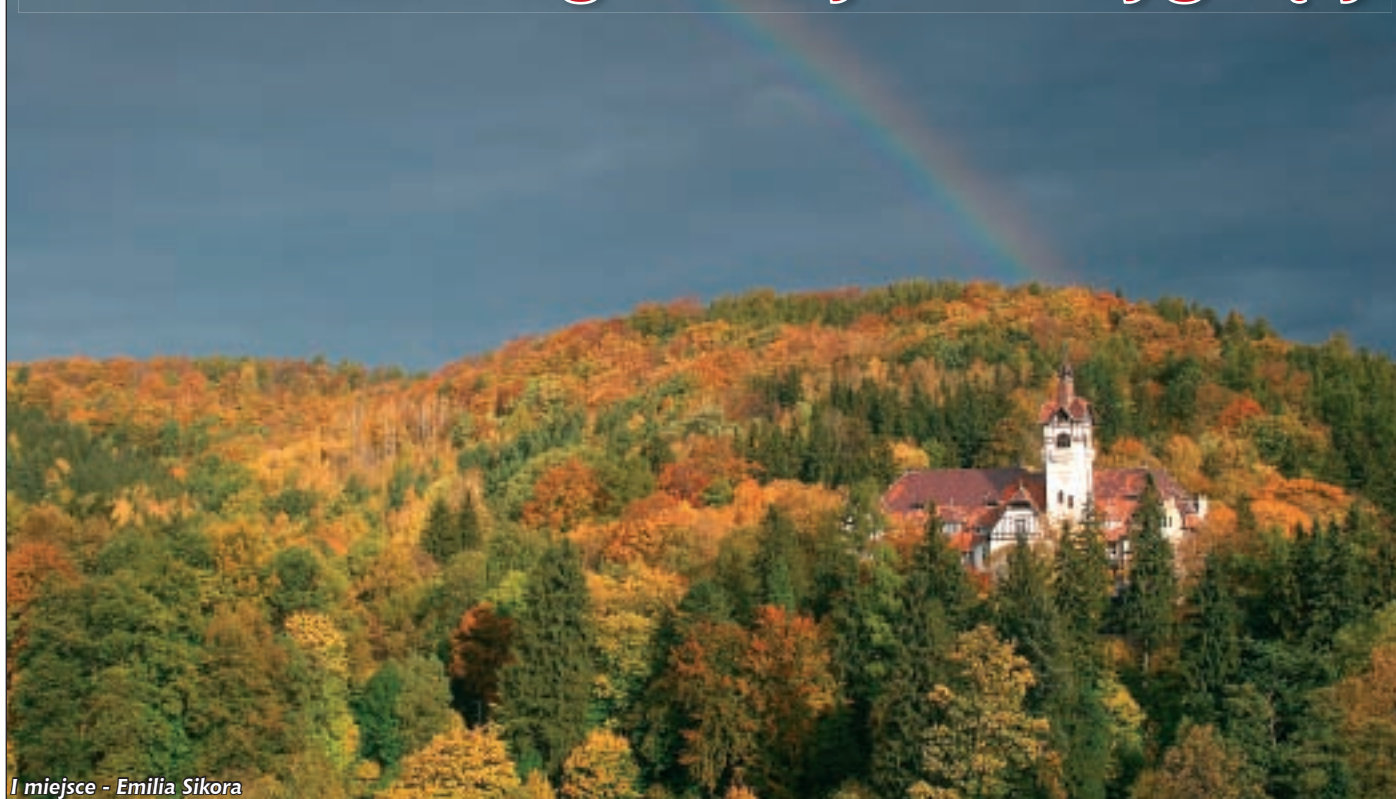
I miejsce - Emilia Sikora