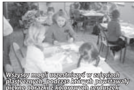
Wszyscy mogli uczestniczyć w zajęciach plastycznych, podczas których powstawały piękne obrazki z kolorowych serduszek

Wszyscy mogli uczestniczyć w zajęciach plastycznych, podczas których powstawały piękne obrazki z kolorowych serduszek. Były to rybki, kotki i kwiatuszki. Później przyszedł czas na mały wysiłek fizyczny; gry sportowe i zabawy z chustą animacyjną.