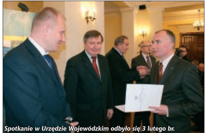
Spotkanie w Urzędzie Wojewódzkim odbyło się 3 lutego br.

32 mln złotych - na tą właśnie kwotę Jerzy Miller, minister spraw wewnętrznych i administracji wręczył samorządowcom z Dolnego Śląska promesy na usuwanie skutków ubiegłorocznych klęsk żywiołowych.