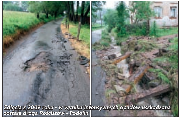
Zdjęcia z 2009 roku - w wyniku intensywnych opadów uszkodzona została droga Rościszów - Podolin