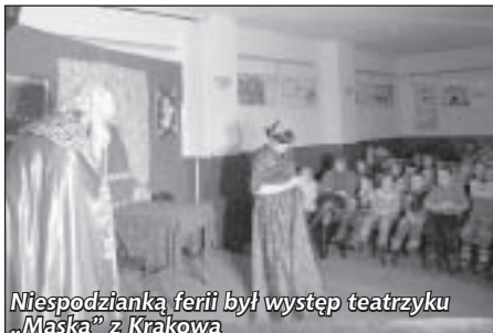
Niespodzianką ferii był występ teatryku „Maska” z Krakowa

do dzieci w formie programu zadań ferii zimowych. Uczestnicy zajęć „wędrowali” z Pyzą do: Żelazowej Woli, gdzie wysłuchali koncertu Szopenowskiego w wykonaniu J. Olejniczaka, Warszawy z bazyliżkiem, Gniezna i mysiej wieży z Popielem, Warmii i Mazur poznając rycerskie szlaki, oraz na Kurpie i Kujawy poznając zwyczaj ludowe w tym regionie Polski. Niespodzianką ferii był występ teatryku „Maska” z Krakowa „achom”, „ochom”, i radosnym okrzykiem nie było końca.