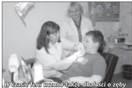
W czasie ferii uczono także dbałości o zęby

Zajęcia odbywały się w godzinach 9.00-15.00. Uczestnicy korzystali z dwóch posiłków (śniadania i obiadu). Atrakcją tego typu wypoczynku jest zawsze możliwość spędzania czasu w sposób zorganizowany, wśród rówieśników i, co najważniejsze, pod opieką dorosłych. Jednak zawsze dzieci czekają na wycieczki i szczególne wydarzenia.