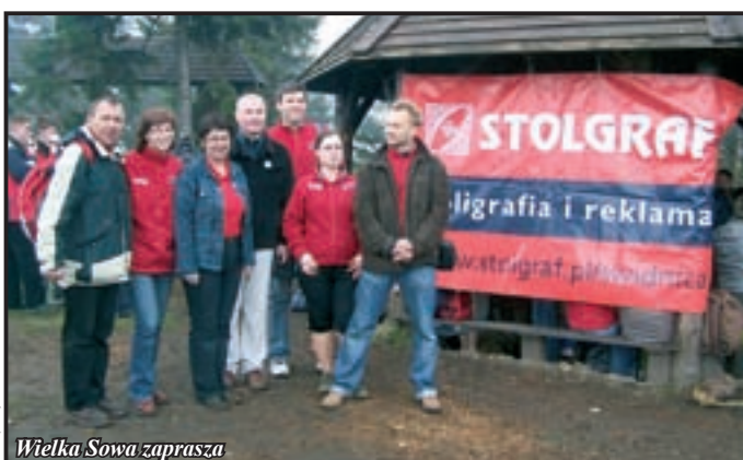
Wielka Sowa zaprasza