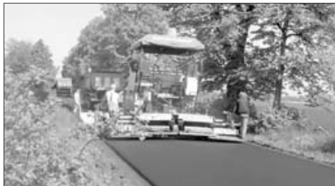
Remont na drodze Pieszycy - Piskorzów to kontynuacja prac z roku ubiegłego

Prace na odcinku 500 mb 8 maja przeprowadziło Świdnickie Przedsiębiorstwo Budowy Dróg i Mostów. Ich wartość to blisko 140 tys. zł.