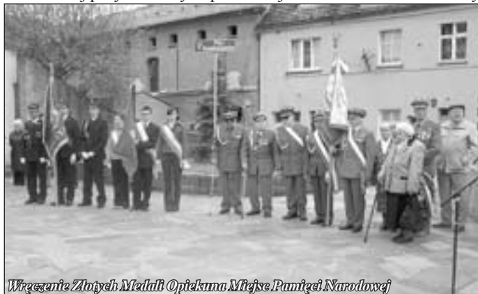
Wręczenie Złotych Medalii Opiekuna Miejsc Pamięci Narodowej

Nabożeństwo w kościele pw. św. Antoniego zostało wzbogacone o wręczenie Złotych Medalii Opiekuna Miejsc Pamięci Narodowej przyznawanych przez Wojewódzki Komitet Ochrony