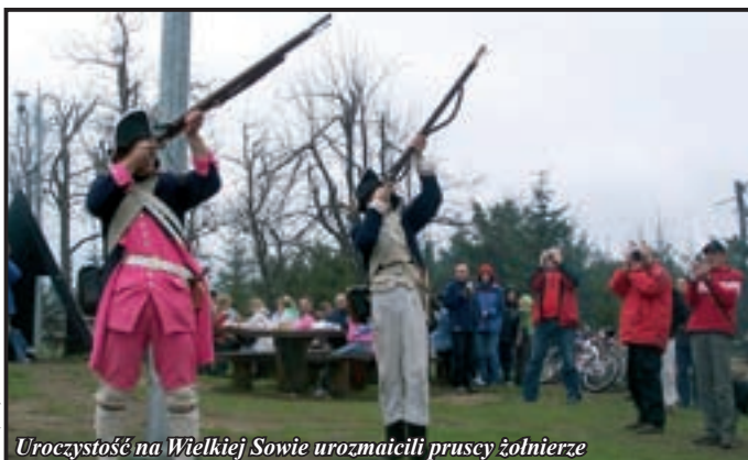
Uroczystość na Wielkiej Sowie urozmaicili pruscy żołnierze