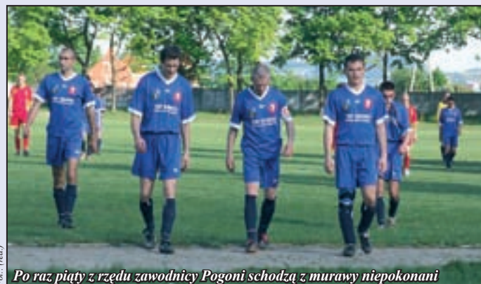
Po raz piąty w rzędu zawodnicy Pogoni schodzą z murawy niepokonani

Pogoń zajmuje obecnie 11 miejsce w swojej grupie i systematycznie awansuje w tabeli. Do rozegrania w bieżącym sezonie pozostało 5 spotkań