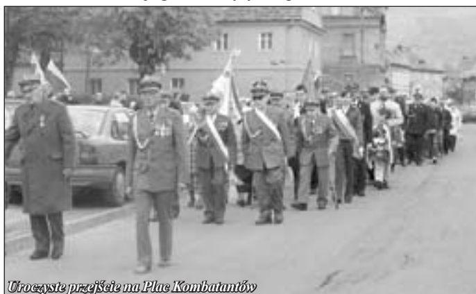
Uroczyste przejście na Plac Kombatantów

Dalsza część uroczystości miała miejsce przy Pomniku Pamięci Narodowej, gdzie odbyły się przemówienia Burmistrza