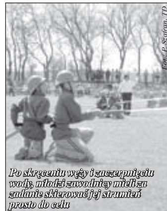
Po skróceniu węży i zaczepnięciu wody, młodzi zawodnicy mieli za zadanie skierować jej strumień prosto do celu

Tego samego dnia na strażaków sportowców czekała niespodzianka. W sali sołectkiej w Piskorzowie z rąk zastępcy burmistrza Pieszyc