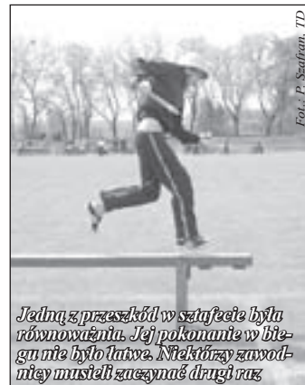
Jedną z przeszkód w szafce była równowaga. Jej pokonanie w biegu nie było łatwe. Niektórzy zawodnicy musieli zacząć drugi raz

Piskorzów okazał się też najlepszy w kategorii seniorów, w której startowało aż 14 drużyn. Drugie