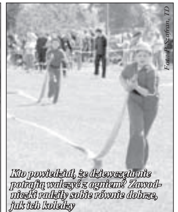
Kto powiedział, że dziewczęta nie potrafią waleczyć z ogniem? Zawodniczki rwały sobie równie dobrze, jak ich koledzy

Pożarnej, która kilkakrotnie stawała na podium.