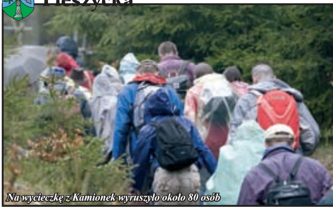
Na wycieczkę z Kamionek wyruszyło około 80 osób