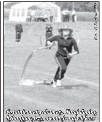
Ostatnie metry do mety. Tutaj doping był najgorętszy, a emocje największe

przybyły całe rodziny, by dopinguować swoich reprezentantów. Zwycięzcy otrzymali pamiątkowe puchary oraz nagrody rzeczowe.