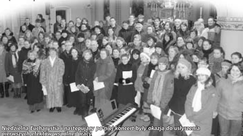
Niedzielną Eucharystia i następujący po niej koncert były okazją do usłyszenia pierwszych efektów wspólnej pracy

NA PODST. MIH, BM, GAZETA WYBORCZA, DODATEK REGIONALNY WROCLAW