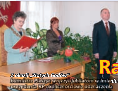
Z okazji „Złotych Godów” burmistrz Pleszyc wręczył jubilatom w imieniu prezydenta RP okolicznościowe odznaczenia