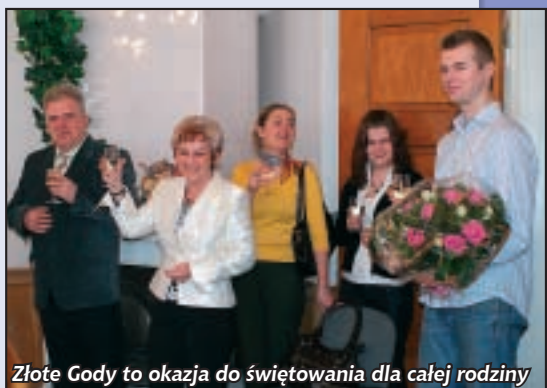
Złote Gody to okazja do świętowania dla całej rodziny