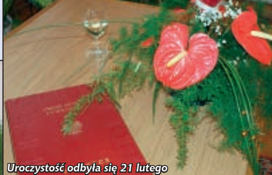
Uroczystość odbyła się 21 lutego