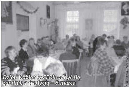
Dzień Kobiet w ZERiI odbył się zgodnie z tradycją – 8 marca