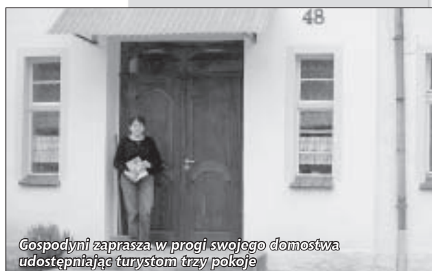
Gospodyni zaprasza w progi swojego domostwa udostępniając turystom trzy pokoje