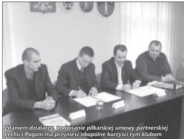
Zdaniem działaczy, podpisanie piłkarskiej umowy partnerskiej Lechii i Pogoni ma przynieść obopólne korzyści tym klubom