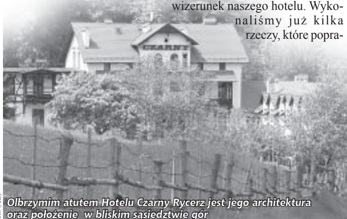
Fig.: (red.) Olbrzymim atutem Hotelu Czarny Rycerz jest jego architektura oraz położenie w bliskim sąsiedztwie gór

Dziękuję za rozmowę i życzę pomyślnej realizacji założonych planów.