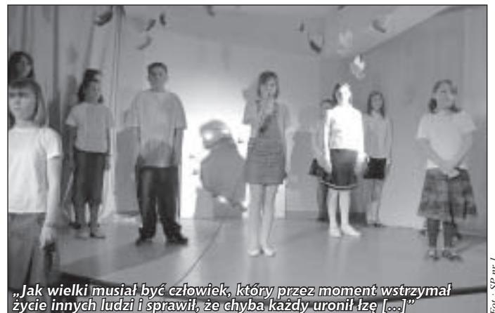
„Jak wielki musiał być człowiek, który przez moment wstrzymał życie innych ludzi i sprawił, że chyba każdy uronił łzę [...]”