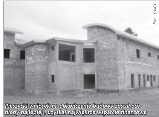
Pieszycy wniosek na dokończenie budowy został oceniony najlepiej i uzyskał największe wsparcie finansowe

Całkowita wartość: 7 710 578,00 Kwota dofinansowania: 4 590 000,00 Poziom dofinansowania: 85,00% kosztów kwalifikowanych