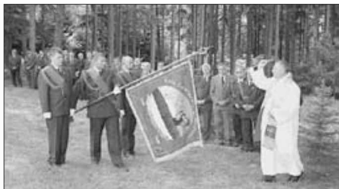
Najważniejszym punktem uroczystości było wręczenie sztandaru i poświęcenie go

Następnie fundatorzy wbili w drzewiec sztandaru gwoździe. Zebrani uczestniczyli także w mszy polowej, podczas której zagrał zespół sygnalistów myśliwskich. W części artystycznej można było wysłuchać koncertu sygnalistów, a także fragmentów z „Pana Tadeusza” dotyczących gry Wojskiego, poloneza i uczy w wykonaniu podopiecznych Spółdzielczego