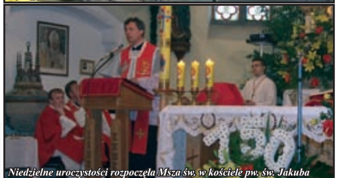
Niedzielne uroczystości rozpoczęła Msza św. w kościele pw. św. Jakuba