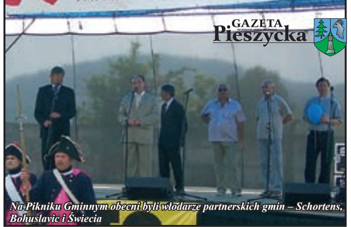
Na Pikniku Gminnym obecni byli wóldarze partnerskich gmin – Schortens, Bohuslavie i Świecia

zakończyły się w późnych godzinach wieczornych, a każdy uczestnik na pamiątkę tych wyjątkowych dni otrzymał okolicznościowy prezent w postaci kompletu widokówek z wizerunkiem kościoła p.w. Św. Jakuba.