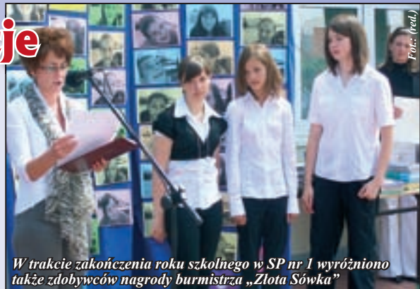
W trakcie zakończenia roku szkolnego w SP nr 1 wyróżniono także zdobywców nagrody burmistrza „Złota Sówka”

Wszystkim uczniom życzymy gorących i przede wszystkim – bezpiecznych wakacji,