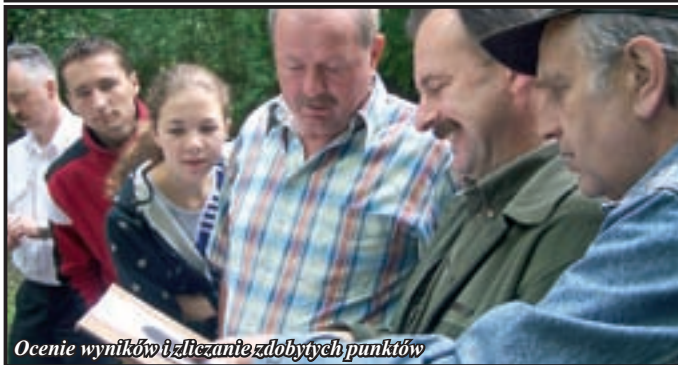
Ocenie wyników i wręczenie zdobytych punktów