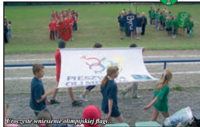
Uroczyste wniesienie olimpijskiej flagi...