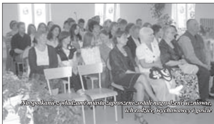
Na spotkaniu z władzami miasta zaproszeni zostali nagrodzeni uczniowie, ich rodzice, wychowawcy i goście