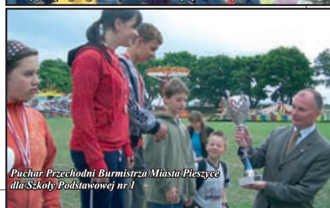
Puchar Przechodni Burmistrza Miasta Pieszycze dla Szkoły Podstawowej nr 1