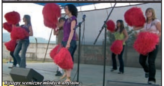
Występy sceniczne młodych artystów