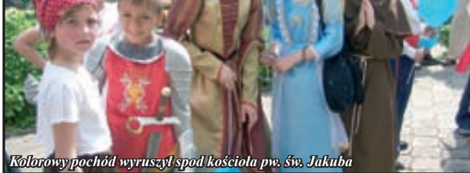
Kolorowy pochód wyruszył spod kościoła pw. św. Jakuba