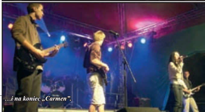
...i na koniec „Carmen”.