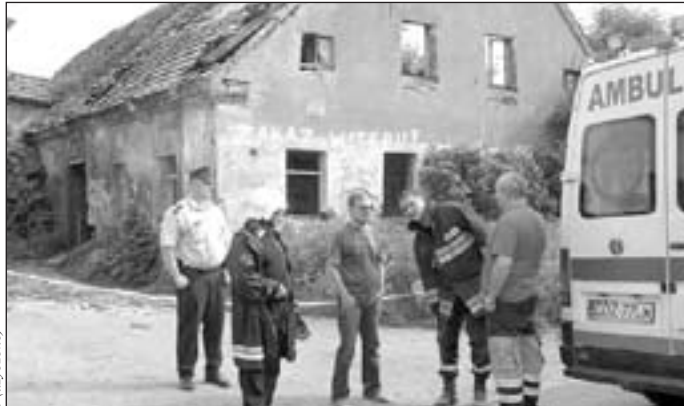
Zawalony budynek przy ulicy Kopernika posiadał użycie współwłaścicieli

Istniało podejrzenie, że w chwili wypadku, w budynku znajdowali się ludzie. Mieszkańcy mówili o dwóch lub czterech dziewczynkach,