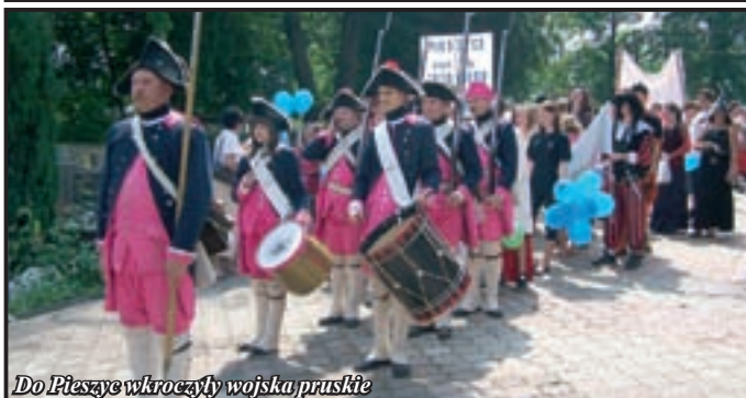
Do Pieszycy wkroczyły wojska pruskie