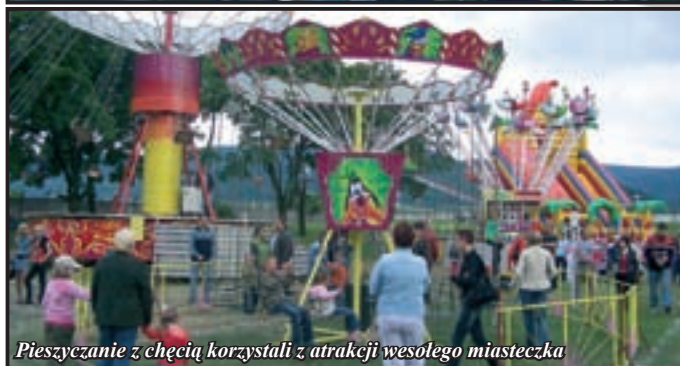
Pieszyccanie z chęcią korzystali z atrakcji wesołego miasteczka