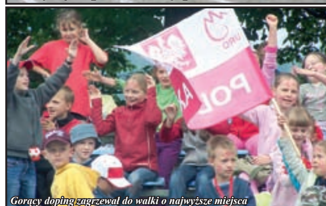
Gotący doping zagrzewał do walki o najwyższe miejsca