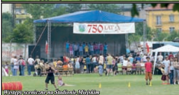
Występy sceniczne na Stadionie Miejskim