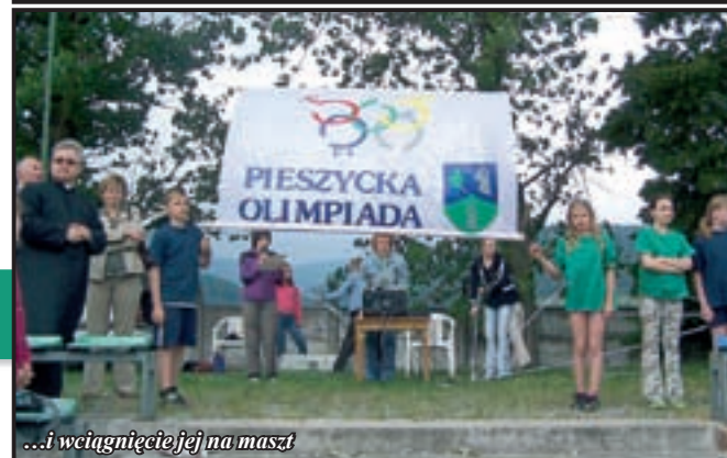
...i wciągnięcie jej na maszt