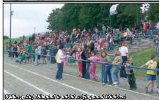
W Pieszyczej Olimpiadzie udział wzięło ponad 330 dzieci