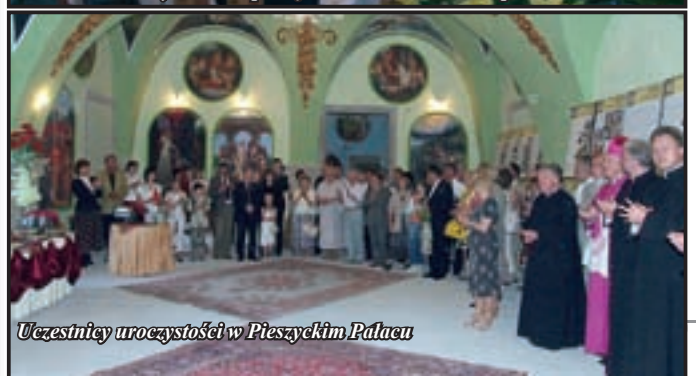
Uczestnicy uroczystości w Pieszyckim Pałacu