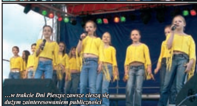
...w trakcie Dni Pieszyce zawsze cieszą się dużym zainteresowaniem publiczności