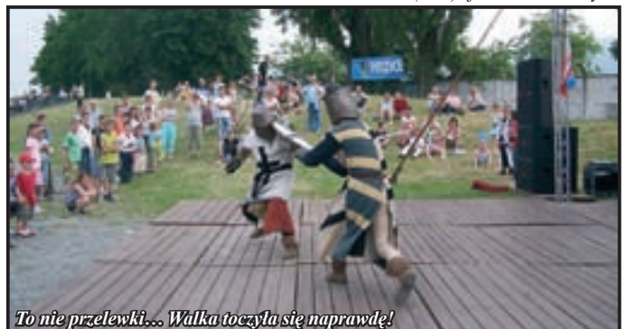
To nie przelewki... Walka toczyła się naprawdę!