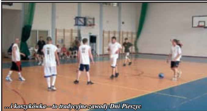
...i koszykówka – to tradycyjne zawody Dni Pieszyc