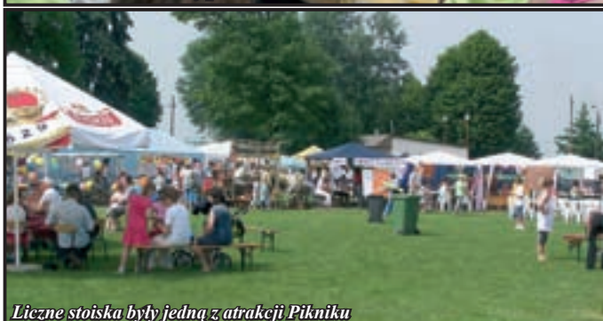
Liczne stoiska były jedną z atrakcji Pikniku