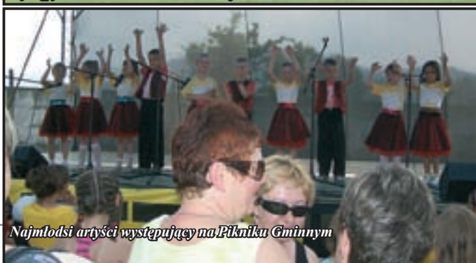
Najmłodsi artyści występujący na Pikniku Gminnym