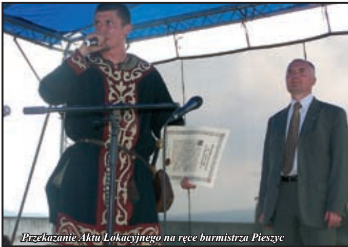
Przekazanie Aktu Lokacyjnego na ręce burmistrza Pieszyc

nych parafian i mieszkańców gminy. Przedstawiciel Wojewódzkiego Konserwatora Zabytków oraz właściciele okolicznych pałaców, przedstawiciele lokalnych i regionalnych mediów.