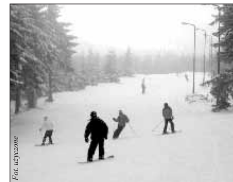
Formalnie staliśmy się właścicielem tego obiektu 26 stycznia 2007 r. – mówi szef firmy „JANAT”