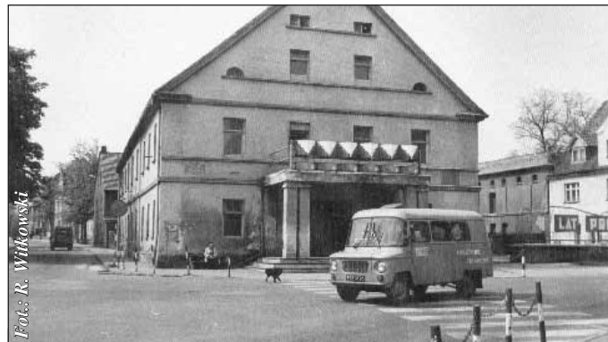
Tak było jeszcze w 1984 roku. Dziś na miejscu “Ludowca” znajduje się Pomnik Pamięci Narodowej

Zdjęcie pochodzi z 1984 roku, kiedy to też rozebrano budynek.