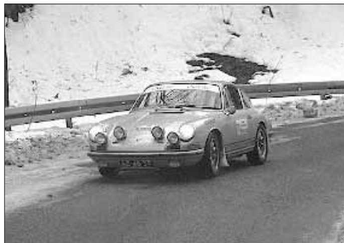
Najstarszym samochodem biorącym udział w zawodach był Bentley 3-4.5 z 1924 roku. Nie zabrakło także kultowych rajdowych pojazdów z lat 50-, 60- i początku 70-tych

Na listę zgłoszeń trafiła rekordowa liczba 110 załóg. Najstarszym samochodem biorącym udział w zawodach jest Bentley 3-4.5 z 1924 roku. Nie zabrakło także kultowych rajdowych pojazdów z lat 50-, 60- i początku 70-tych: Saabów 96, BMW 2002, Lancii Fulvii, Fordów Lotus Cortina i Escort Mk 1, Porsche 911, Alf Romeo Giulia i GTV.