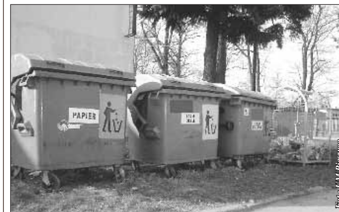
Obecnie na terenie gminy Pieszycy funkcjonują 24 gniazda do selektywnej zbiórki odpadów

Ci z Państwa, którzy segregują domowe odpady mogą być pewni, że ich wysiłek nie idzie na marne. Odpady opakowaniowe z pojemników do segregacji są doczyszczane w bazie przedsiębiorstwa obsługującego zbiórkę i wysyłane do zakładów zajmujących się ich recyklingiem. Tych, którzy odpadów jeszcze nie segregują gorąco do tego namawiamy. Segregowanie odpadów jest standardem w krajach starej unii, a także podstawą każdego nowoczesnego systemu gospodarki odpadami i co więcej - obowiązkiem wynikającym z ustawy o opadach i ustawy utrzymania czystości i porządku w gminach.