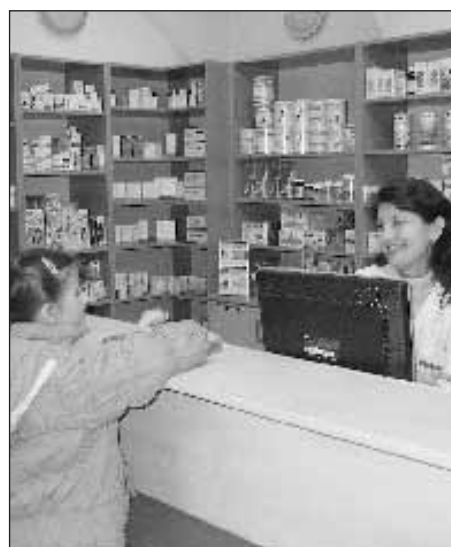
Informacje o dostępnych w sprzedaży lekach można uzyskać telefonicznie