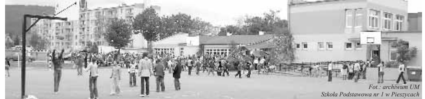
Fot.: archiwum UM Szkoła Podstawowa nr 1 w Pieszycach

„Chociaż minęło już wiele lat, Babcia jest fajna jak koleżanka Jest z nami zawsze za pan brat, mówi, że życie to niespodzianka...”