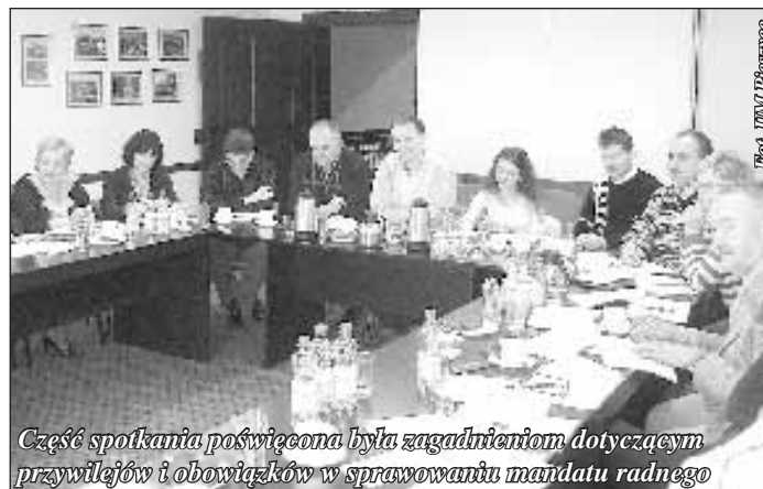
Część spotkania poświęcona była zagadnieniom dotyczącym przywilejów i obowiązków w sprawowaniu mandatu radnego

17 lutego 2007 – 3 latka i ponad 185 000 tysięcy wejść.