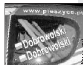
Od 09.2005 r. na aucie Marcina i Michała widnieją reklamy Pieszyc