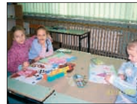
...i w szkole.