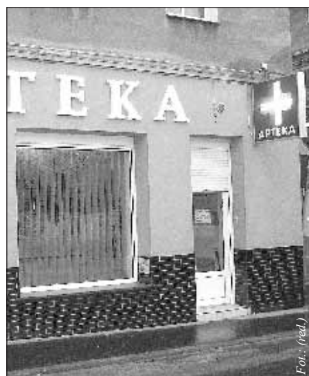
Od nowego roku w budynku przy ulicy Kościuszki 4a funkcjonuje nowa apteka

Apteka świadczy pełną gamę usług farmaceutycznych. Można tutaj realizować recepty (także te za 0,01 zł), a także skorzystać z bogatej oferty parafarmaceutyków, suplementów diety, kosmetyków. UWAGA – w aptece można także nieodpłatnie zmierzyć ciśnienie. Informacje o dostępnych w sprzedaży lekach można uzyskać telefonicznie pod nr tel.: (074) 8365-121.