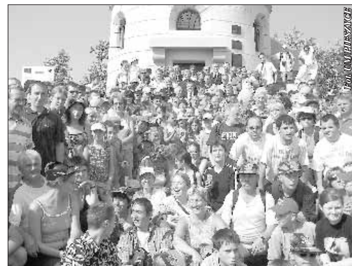
16 czerwca 2006 roku tłum ludzi świętował ponowne oddanie wieży widokowej na Wielkiej Sowie do użytku

- Pomysł na forum internetowe zrodził się już dosyć dawno. Lecz do zrealizowania tego projektu zawsze brakowało mi czasu. Stopniowo gromadziłem zapiski z pomysłami jakie można