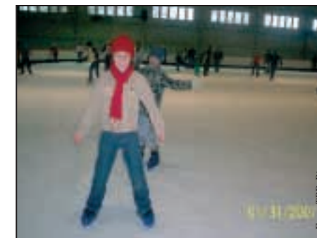
Na lodowisku w Świdnicy...