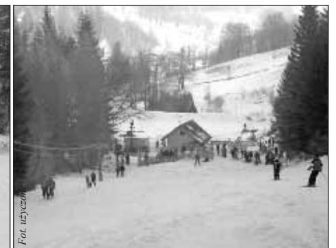
Zainstalowaliśmy elektroniczny system dostępu, dokupiliśmy dodatkową armatkę śnieżną i zakupiliśmy największy model ratraka z oferty firmy KASBOMERR

możliwość udostępnienia wyciągu turystom np. w sezonie letnim?