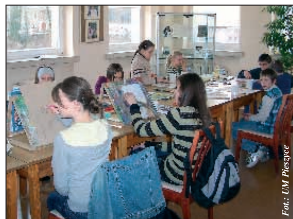
Na kolejną długą przerwę od lekcji pozostaje czekać uczniom do czerwca

Biblioteka, tak jak i Filia, oferowała udział w różnych grach i zabawach, zajęciach plastycznych czy w pływaniu oraz korzystaniu z internetu. W siedzibie MBP można skorzystać nieodpłatnie z 4 komputerów, a w Filii z jednego.