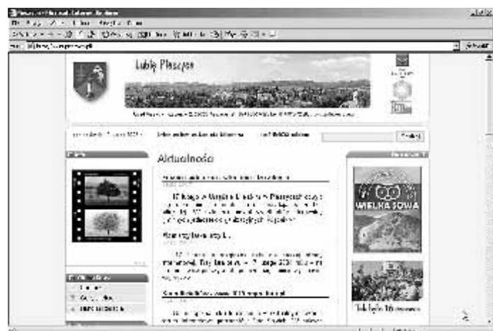
Obecna witryna internetowa UM w Pieszcach istnieje od lutego 2004 r.

Przez pierwszy rok funkcjonowania w „wirtualnym świecie” internetowa wizytówka Pieszycy naliczyła nieco ponad 20 000 wejść. 17 lutego 2006 roku, a więc po dwóch latach funkcjonowania, licznik wskazywał już liczbę przewyższającą 80 000. Ważną dla nas datą był 23 maja 2006 r. – wtedy na stronie pieszycycka.pl gościliśmy 100 000 internautę. A dziś nasz „trzylatek” cieszy się prawie 185 000 wejść, blisko 1100 newsami, 650 „podstronami” i ponad 200 galeriami zdjęć.