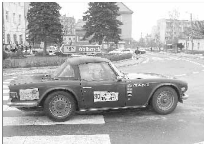
Maraton klasycznych samochodów sportowych po raz pierwszy w historii zawiał do Polski