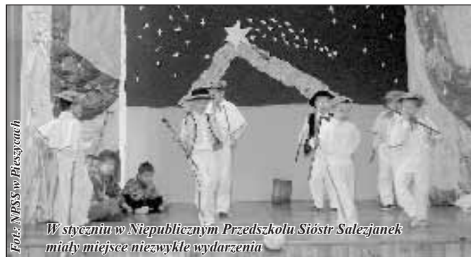
W styczniu w Niepublicznym Przedszkolu Sióstr Salezjanek miały miejsce niezwykle wydarzenia

Przedszkolaki wystąpiły w Jasełkach. W ramach tego programu dziewczynki odegrały rolę śnieżynki - które przyozdobiły świat śniegiem oraz Aniołków, które cieszyły się przyjścia na ziemię Małego Dziecięcia. Tańcząc rozgłaszały wieść o na-