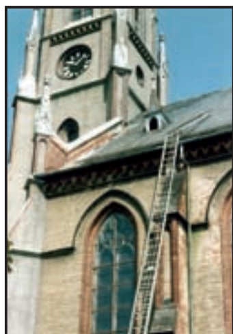
Lato 2002 - rozpoczęcie prac remontowych