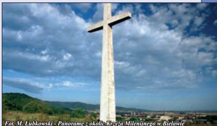
Panoramę z okolic Krzyża Milenijnego w Bielawie