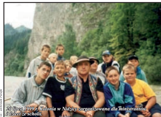
20 lipca 1999 r. Kolonia w Nidzicy zorganizowana dla ministrantów i dzieci ze scholii.