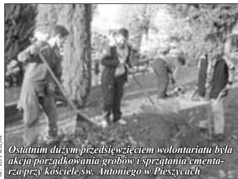
Ostatnim dużym przedsięwzięciem wolontariatu była akcja porządkowania grobów i sprzątnięcia cmentarza przy kościele św. Antoniego w Pieszcach

Trzeba zaznaczyć, że mimo ogromnych chęci wolontariuszy do niesienia pomocy, imprezy te nie mogłyby się odbyć bez wsparcia osób