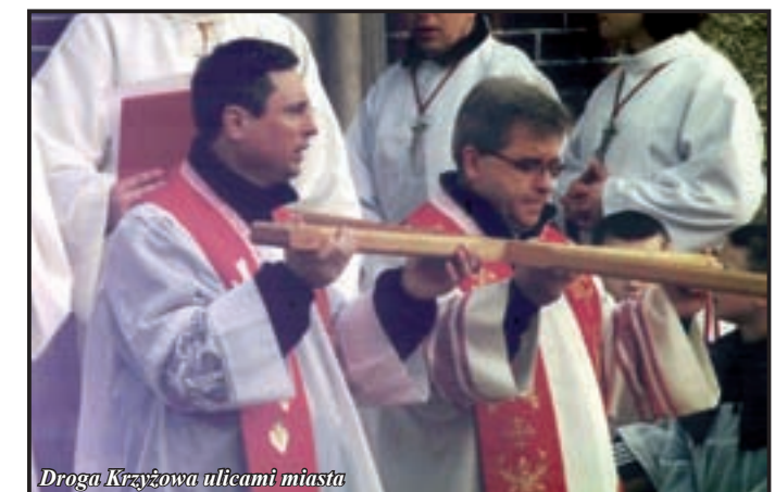
Droga Krzyżowa ulicami miasta