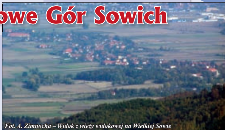
Widok z wieży widokowej na Wielkiej Sowie