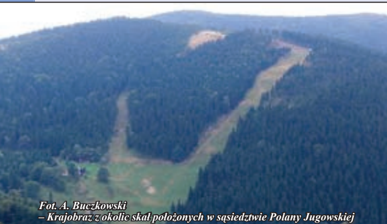
Krajobraz z okolic skał położonych w sąsiedztwie Polany Jugowskiej