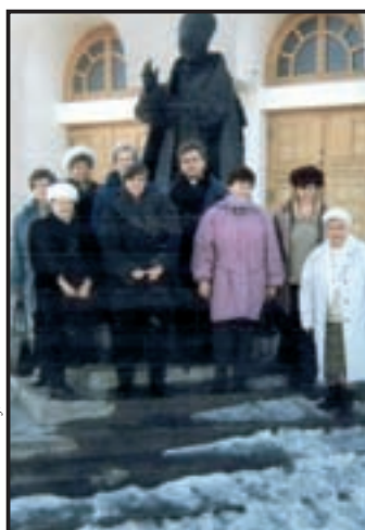
1999 r. - Pielgrzymka do Wadowic, Krakowa i Łagiewnik