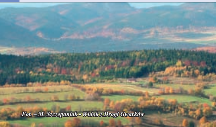
Fot. - M. Szczepaniak - Widok z Drogi Gwarków