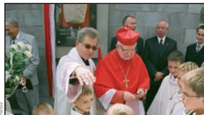
2006 r. Wmurowanie kamienia węgielnego w mury budowanej Przychodni Miejskiej