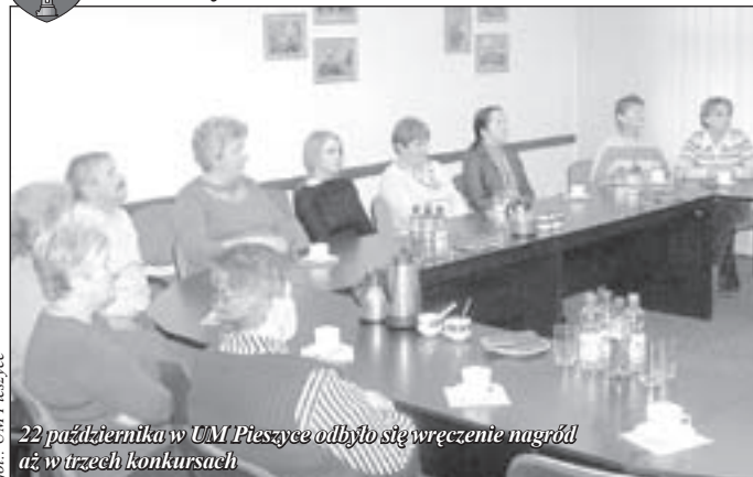
22 października w UM Pieszycy odbyło się wręczenie nagród aż w trzech konkursach

Tradycyjne na specjalnie przygotowanym w Urzędzie Miejskim w Pieszycach spotkaniu odbyło się wręczenie nagród