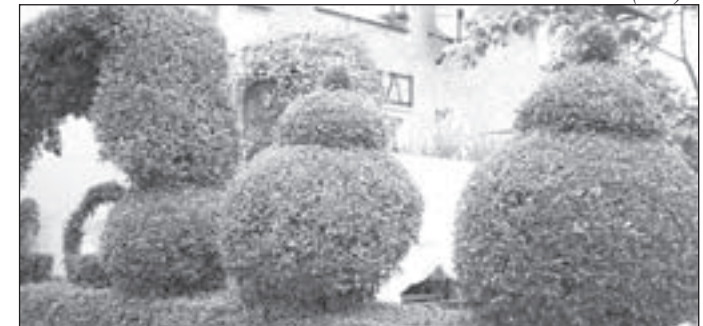
1 miejsce - w Konkursie Zieleni Wokół Nas 2007 – kategoria Skwery - Grażyna Rogaczewska

Weronika Dobrowolska Lat 11, klasa V SP nr 1 w Pieszycach