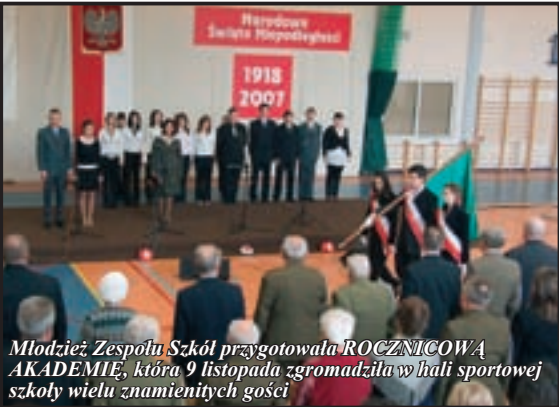
Młodzież Zespołu Szkół przygotowała ROCZNICOWĄ AKADEMIE, która 9 listopada zgromadziła w hali sportowej szkoły wielu znamienitych gości

bolicznego odsłonięcia tabliczki z obowiązującą nazwą placu na którym znajduje się Pomnik Pamięci Narodowej. Zgodnie z oczekiwaniem środowisk kombatanckich plac ten został nazwany Placem Kombatantów.