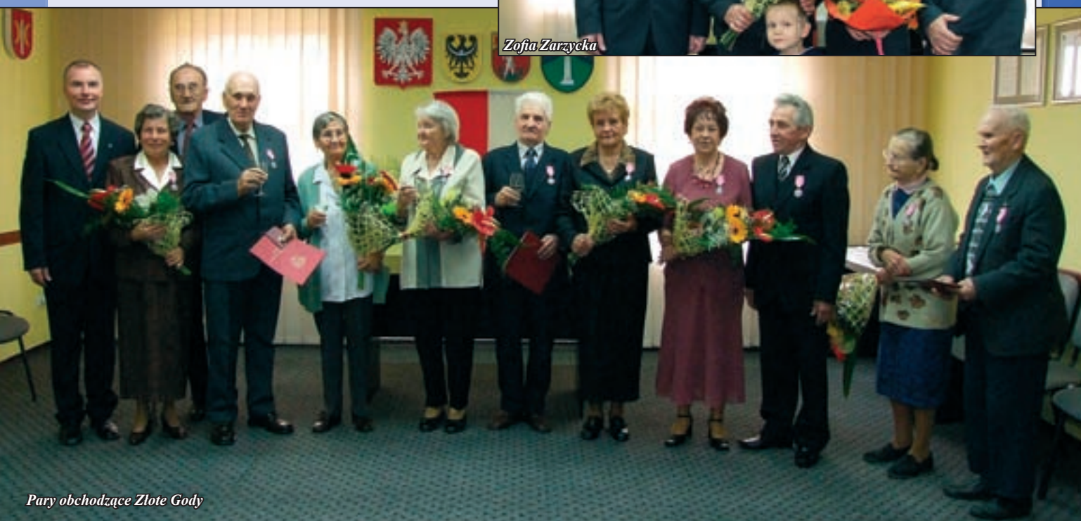
Pary obchodzące Złote Gody