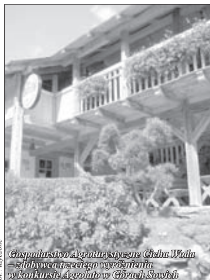
Gospodarstwo Agroturystyczne Cicha Woda – zdobywca trzeciego wyróżnienia w konkursie Agrolato w Górach Sowich

Tradycyjne na specjalnie przygotowanym w Urzędzie Miejskim w Pieszycach spotkaniu odbyło się wręczenie nagród