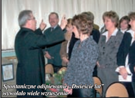
Spontaniczne odśpiewanie „Dwieście lat” wywołało wiele wzruszenia