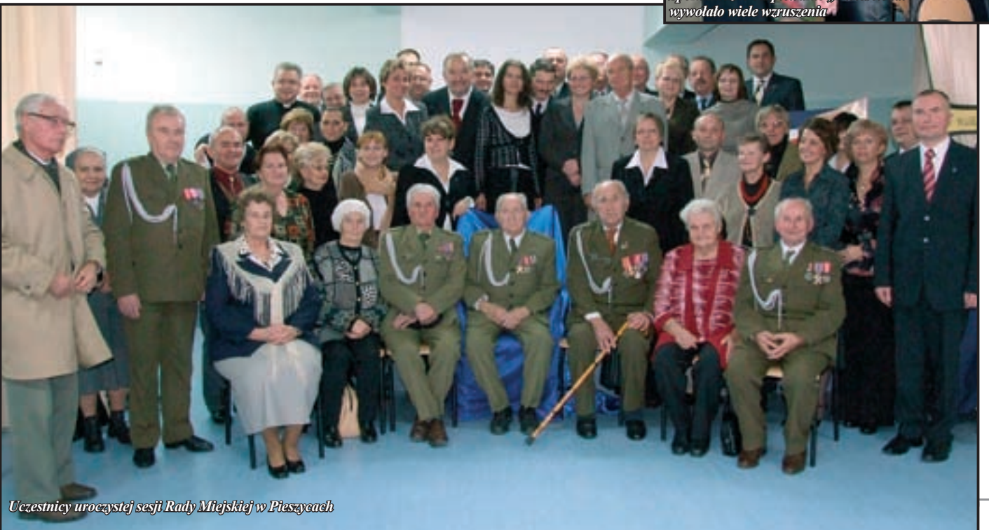
Uczestnicy uroczystej sesji Rady Miejskiej w Pieszcach