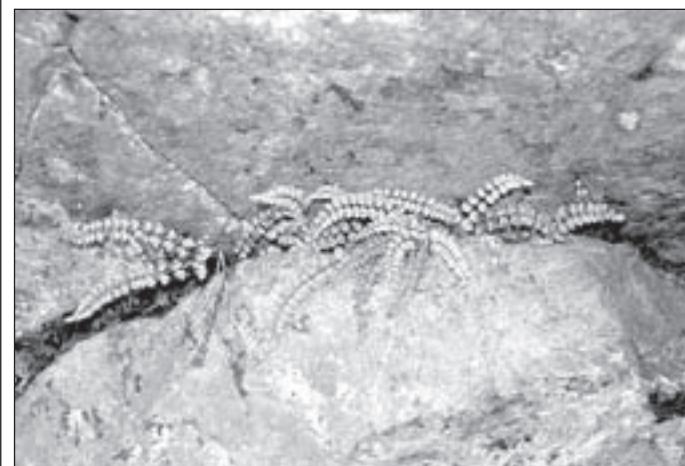
Gatunek jest regularnie ujmowany w Czerwonych Listach i Księgach

Zanokcica serpentynowa jest spotykana wyłącznie na Dolnym Śląsku (jako jedynym obszarze występowania skał serpentynitowych). Dziś istnieje jedenaście jej stanowisk aktualnych. Jednym ze stanowisk występowanie zanokcicy jest teren gminy Pieszycy (Kamionki).