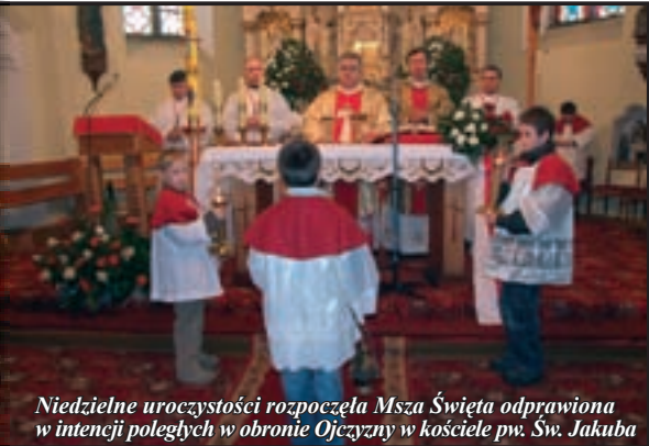
Niedzielne uroczystości rozpoczęła Msza Święta odprawiona w intencji poległych w obronie Ojczyzny w kościele pw. Św. Jakuba

Niedzielne uroczystości rozpoczęła Msza Święta odprawiona w intencji poległych w obronie Ojczyzny w kościele pw. Św. Jakuba. Koncelebrze przewodniczył