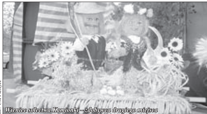
Wieniec solectwa Kamionki – zdobywca drugiego miejsca