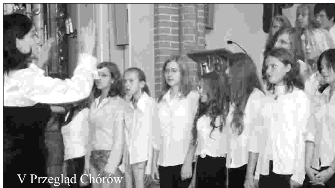
V Przegląd Chórów