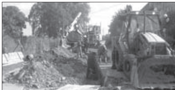
Prace związane z budową kanalizacji w ul. M. Konopnickiej powinny zostać zakończone do połowy listopada br.

żenie krawężnika, ułożenie ścieku betonowego, wykonanie warstwy wyrównawczej z kruszywa