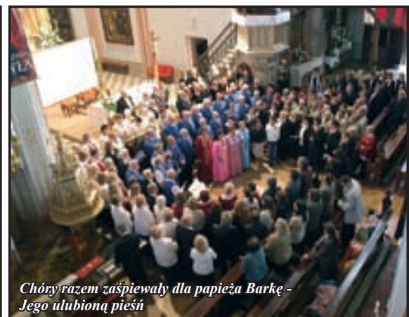
Chóry razem zaśpiewały dla papieża Barkę - Jego ulubioną pieśń