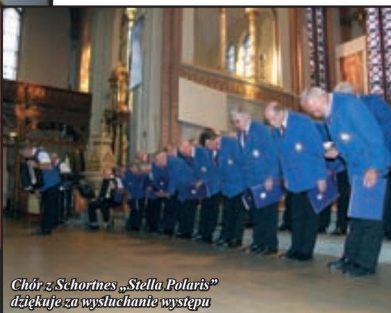
Chór z Schortnes „Stella Polaris” dziękuje za wysłuchanie występu