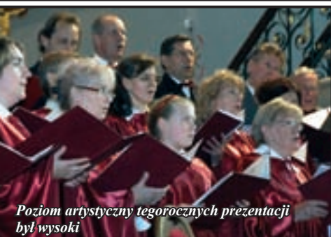
Poziom artystyczny tegorocznych prezentacji był wysoki