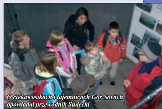
O ciekawostkach i tajemnicach Gór Sowich opowiadał przewodnik Sudecki