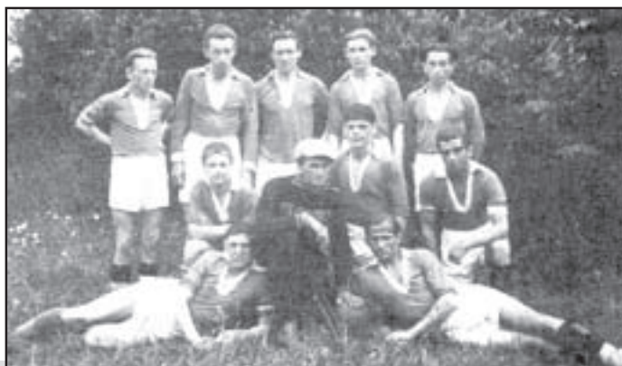
Drużyna piłkarska „Pogoni” Pieszyce