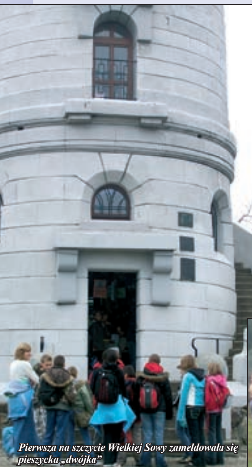
Pierwsza na szczycie Wielkiej Sowy zameldowała się pieszyczka „dwójka”