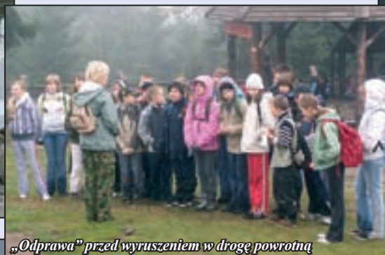
„Odprawa” przed wyruszeniem w drogę powrotną