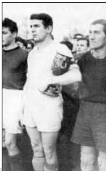
Drużyna piłkarska „Pogoni” Pieszycy po zakończeniu kolejnego sezonu rozgrywek w klasie „A”

Nieco mniejszymi sukcesami poszczycić mógł się drugi pieszycki klub „Włókniarz”, działający przy Pieszycyckich Zakładach Przemysłu Bawełnianego. W 1952 r. zrzeszał on około 300 osób, tu z kolei najlepiej prezentowała się sekcja piłki nożnej.