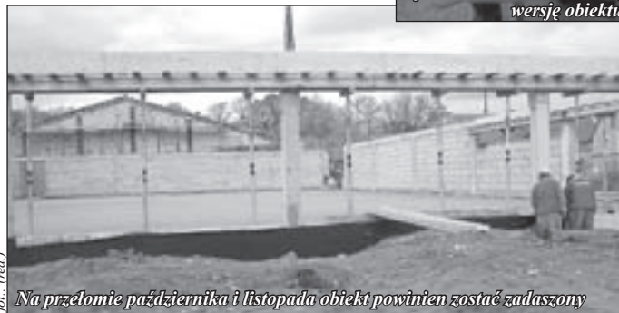
Na przełomie października i listopada obiekt powinien zostać zadany

Spotkanie na placu budowy. Przedstawiciel inwestora Jakub Chodorowski prezentuje burmistrzowi ostateczną wersję obiektu