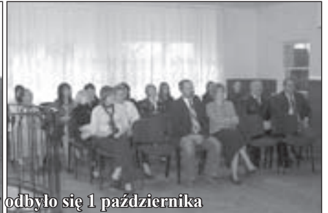
Rozpoczęcie sezonu artystycznego w Pieszcym Centrum Kultury odbyło się 1 października

dziecięcej i młodzieżowej działającej w klubie Spółdzielni Mieszkaniowej w Bielawie.