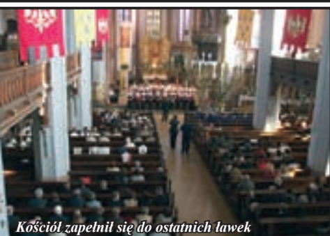
Kościół zapelniał się do ostatnich ławek