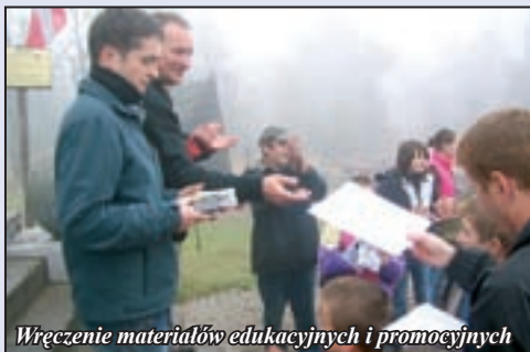
Wręczenie materiałów edukacyjnych i promocyjnych

Niemal setka uczniów z pieszych szkół podstawowych oraz z gminy Nowa Ruda sprawiła, że szlaki turystyczne w Górach Sowich są czystsze.