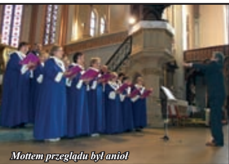
Mottem przeglądu był anioł