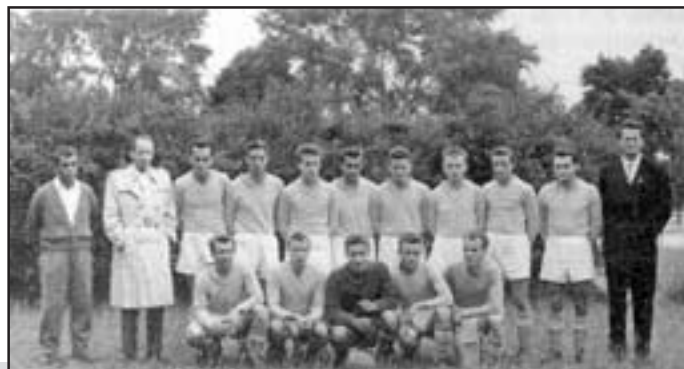
Zawodnicy KS „Pogoń” Pieszycy z czasów występu drużyny w rozgrywkach III ligi