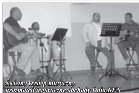
Świetny występ muzyczny urozmaicił tegoroczne obchody Dnia KEN

Kto nie wie i wie, że nie wie - tego naucz; kto wie i nie wie, że wie - tego oświeć; kto wie i wie, że wie - tego naśladowaj!