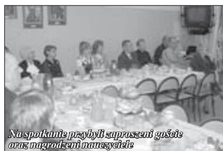
Na spotkanie przybyli zaproszeni goście oraz nagrodzeni nauczyciele