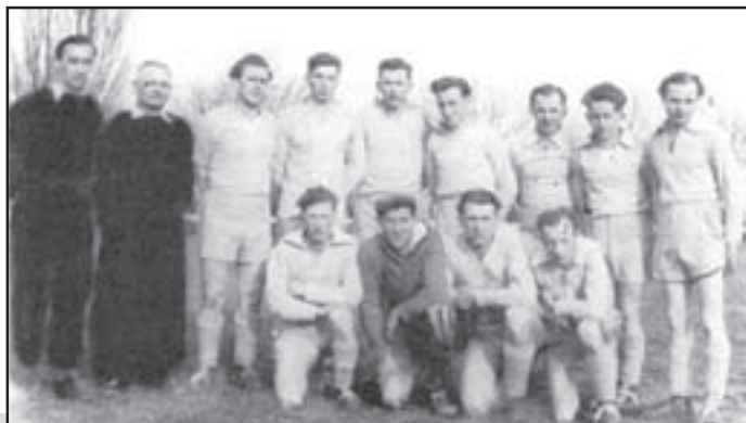
Drużyna piłkarska KS „Pogoń” Pieszyce