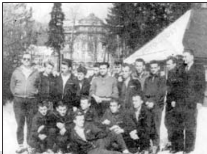
Zgrupowanie przed kolejnym sezonem występów w III lidze

Przejawem głębokiego kryzysu pieszyckiego sportu było faktyczna likwidacja klubu „Pogoń” Pieszycy. Stało się to w końcu lat 60. w wyniku fuzji z KS „Bielawianka”. Decyzja ta stanowiła naturalną konsekwencję likwidacji samodzielności większości przedsiębiorstw branży tekstylnej na terenie miasta, która nastąpiła kilka lat wcześniej, w 1965 r. W jej wyniku tkalnie i przedalnie tworzące dotąd Pieszycyckie Zakłady Przemysłu Bawełnianego weszły w skład BZPB „Bieltex”. W obu przypadkach przeniosło to negatywne skutki dla miejscowego życia społecznego, kulturalnego i sportowego. Pozbawiona niezbędnego w tamtych realiach systemowych, naturalnego wsparcia finansowego i organizacyjnego ze strony miejscowego przemysłu „Pogoń” skazana została