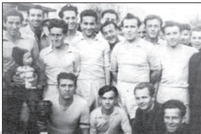
Drużyna piłkarska „Pogoni” Pieszyce po zakończeniu kolejnego sezonu rozgrywek w klasie „A”