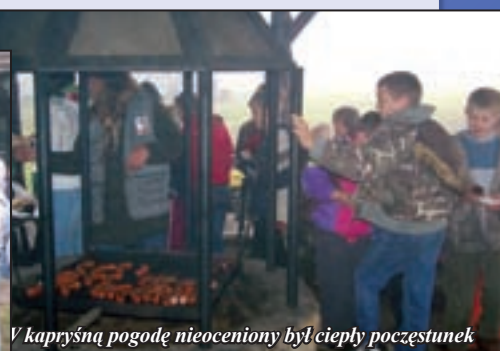
V kapryśną pogodę nieoceniony był ciepły poczęstunek