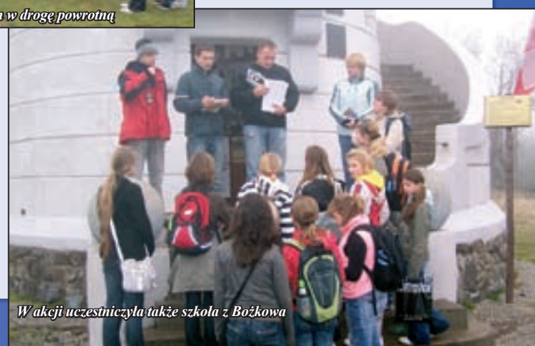
W akcji uczestniczyła także szkoła z Bożkowa