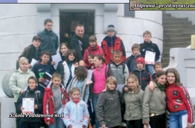
Szkoła Podstawowa nr 1