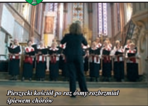
Pieszyccki kościół po raz ósmy rozbrzmiał śpiewem chórów