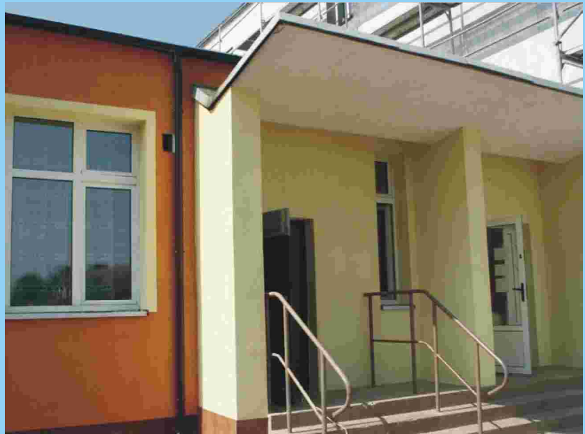
Szkola Podstawowa nr 3 została docieplona i otrzymała nową elewację. Więcej - str. 3