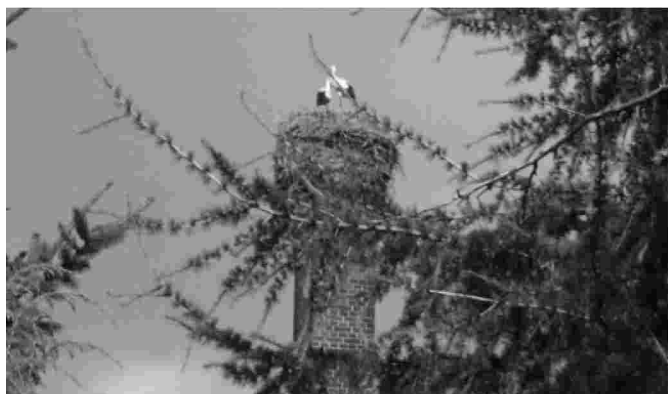
Gniazdo bociana białego przy ulicy Nadbrzeżnej

Gmina Pieszyce tak jak inne kraje w całej Europie, części Azji i Afryki, wzięła udział w VI Międzynarodowym Spisie Bociana Białego. Zebrane w ten sposób dane pozwolą ocenić sytuację bocianów i kontynuować działanie dla ich ochrony. W Polsce zakłada gniazda około 40 900 par tych ptaków. Oznacza to, że co czwarty bocian jest Polakiem. Ponieważ w żadnym innym kraju na świecie nie ma więcej bocianów niż w Polsce. Powodzenie ogólnoświatowej akcji w znacznym stopniu zależy od dokładnego policzenia gniazd w Polsce.