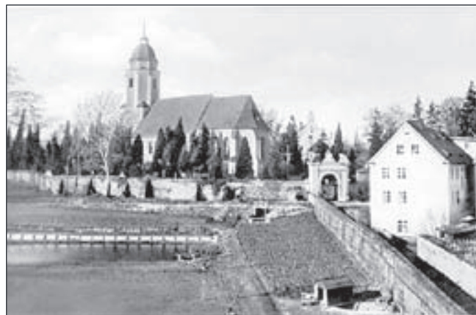
Zdjęcie kościoła z początku XX w.