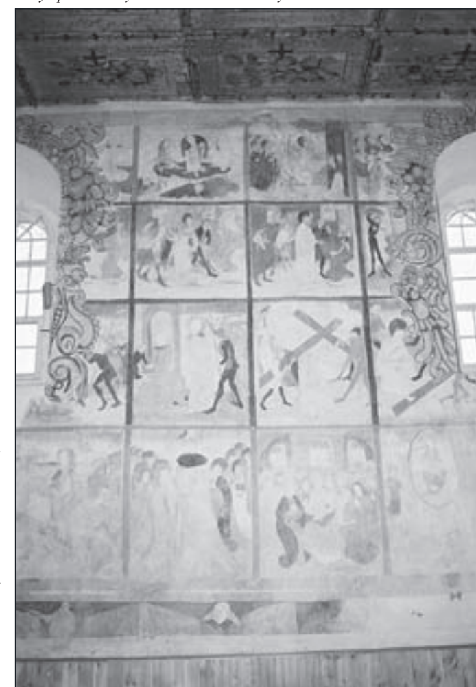
Freski z XVI w.