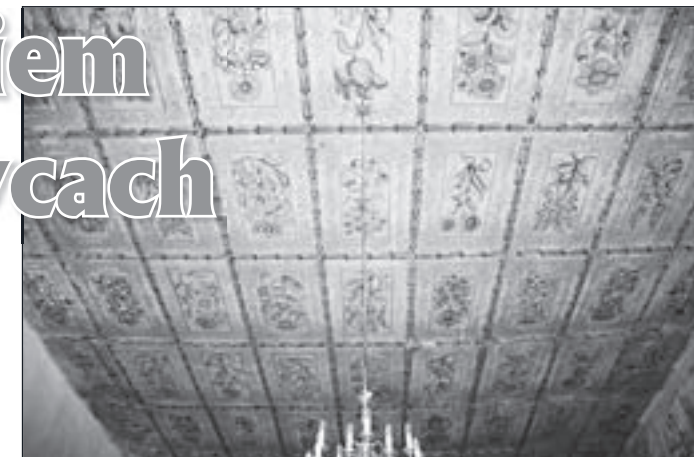
Barokowy sufit w środkowej części kościoła, z 1657 roku, podzielony na kwadraty i pomalowany w białoniebieskie kwiaty

c.d. w następnym numerze GP www.jakub.diecezja.swidnica.pl