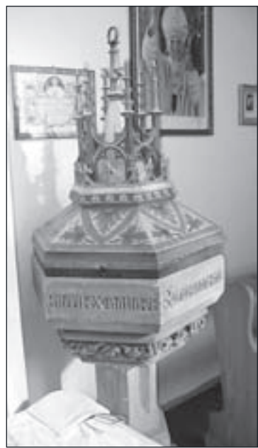
Chrzcielnica z XIX w.

W 966 r. książę Mieszko (książę polski) został ochrzczony, ale jeszcze po 1124 r. można było w tej okolicy natrafić na pogan. W 1000 r. wymieniono po raz pierwszy Wrocław jako diecezję. Nawracanie na chrześcijaństwo odbywało się z dużymi trudnościami i jest oczywiste, że trwało jeszcze długi czas, zanim szczególnie w okolicach gdzie nie było żadnego kultu religijnego, można było stworzyć systemy kościelne. Początkowo kościoły budowano wyłącznie z drewna. W 1052 r. wybudowano dużą drewnianą katedrę we Wrocławiu. Śląsk należał aż do XII wieku do Polski, Kościół do arcybiskupstwa gnieźnieńskiego. W XII wieku mnisi umacniali instytucje kościelne. Szczególnie należy tu wymienić Piotra Własta, albo grafa von Skryni. Z powodu ich doniosłej działalności na rzecz fundacji kościelnych i popieranie dążeń kościoła poprzez powoływanie zakonów w latach 1108 - 1110 został założony przez Piotra pierwszy klasztor w Garkon i obsadzony mnichami flandryjskimi (Augustiner-Chorherren von Arrouaise). Probostwo i kościół zostało poświęcone przez biskupa Piotra 13 stycznia 1110 r. Później przenieśli się mnisi do Wrocławia gdzie objęli kościół św. Wojciecha i latach 1149