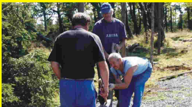
Ogradzanie terenu remontu budowli

Zapraszamy do nowej galerii zdjęć na stronie internetowej Urzędu Miejskiego w Pieszycach www.pieszycy.pl