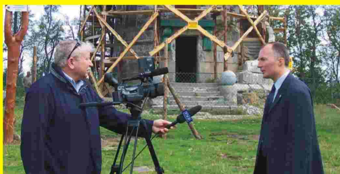
TVP 3 nagrywa materiał na temat remontu wieży

Redakcja: "Gazeta Pieszycycka" 58-250 Pieszycy, ul. T. Kościuszki 2, tel. 836-72-47 Redaguje zespół