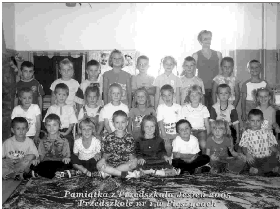
Pamiętka z Przedszkola-Jesień 2005 Przedszkole nr 1 w Pieszycach