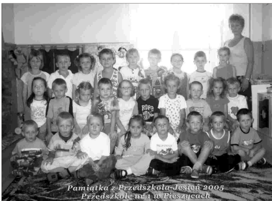
Pamiętka z Przedszkola-Jesień 2005 Przedszkole nr 1 w Pieszycach