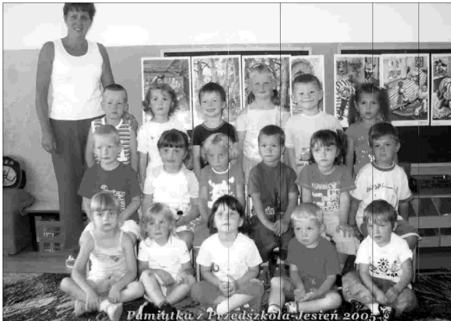
Pamiętka z Przedszkola-Jesień 2005

„Wszystkim Paniom i Panom chłopcy i dziewczynki mali i duzi życzą zawsze wesołej buzi, miłej pracy z uczniami i wspaniałej zabawy z przedszkolakami!”