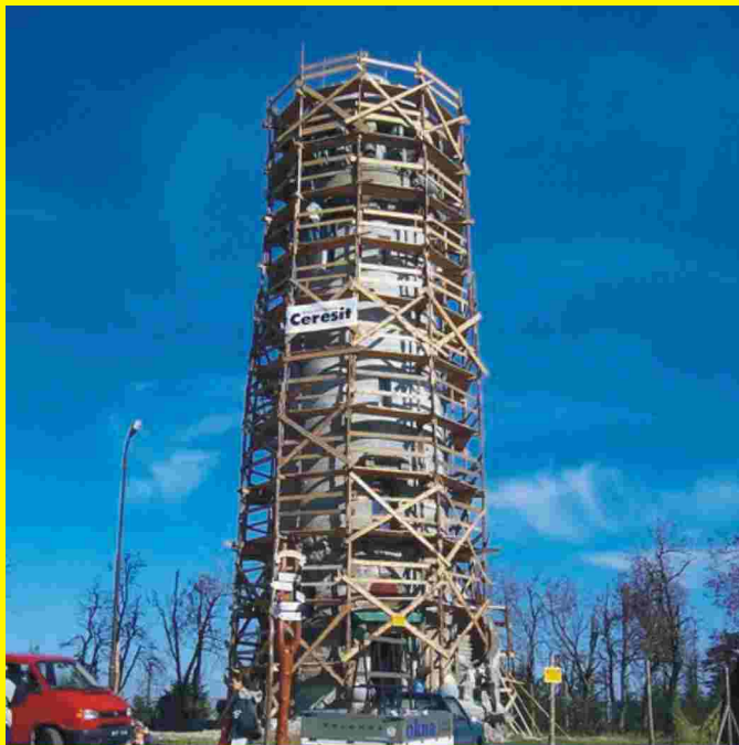
12 października 2005 r. - efekty remontu są coraz bardziej widoczne