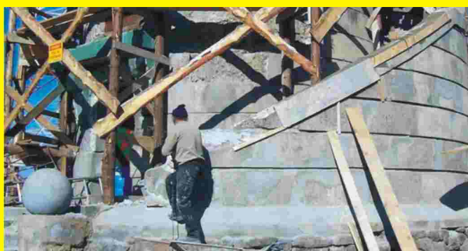
Stan remontu na 12 października 2005 r. - remont wieży przebiega według zaplanowanego harmonogramu

Składi druk: Drukarnia "ARGI" 50-515 Wrocław, ul. Klimasa 6 tel./fax (071) 78 99 218 tel. (071) 78 99 219 argi@wr.home.pl