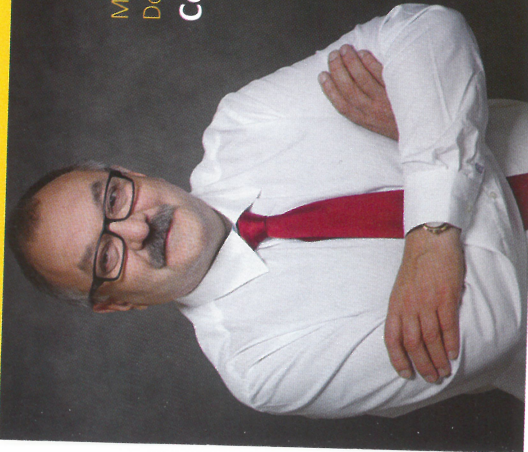
Marszałek Województwa Dolnośląskiego

Jesteśmy spółką samorządu Województwa Dolnośląskiego. Naszą misją jest wspieranie rozwoju gospodarczego regionu, poprzez dostarczanie kapitału finansowego mikro, małym i średnim przedsiębiorcom działającym na terenie Dolnego Śląska.